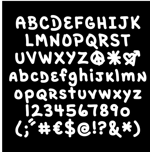
Görsel 4. Cornbread fontu harf, rakam ve işaretlerinin görüntüsü (Maxitype, 2024, 24 Mayıs)

Benzer dönemde isimlerini kamusal alanlarda etiketleyen grafiti sanatçılarından farklı olarak Cornbread'in yazı stili karakteristik özellikler taşımaktadır. Öyle ki 2024 yılında yayınlanan ve McCray'in hayatını konu edinen Cornbread the Legend - Graffiti in Philadelphia (1965-1971) kitabında (aktaran Maxitype, 2024, 24 Mayıs) aynı zamanda sanatçının el yazısından oluşturulan Cornbread isimli font tasarımı da yer almaktadır (görsel 4).