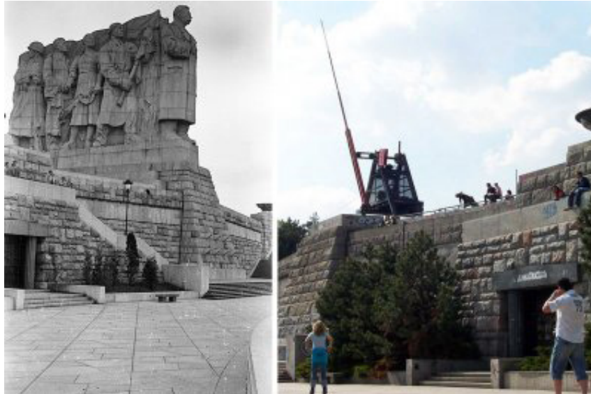
Görsel 3. Prag Stalin Anıtı ve yıkımından sonra 1991 yılında kaidesine dikilen Metronom Kinetik Heykeli, Fotoğraf: Wikimedia Commons. /Aktron

Prag Letná parkında yıkılan Stalin Anıtı gibi Macar Ekim Devrimi sırasında, 23 Ekim 1956'da devrilen ve sonrasında yeni yönetim tarafından kaldırılan Bükreş'teki Joseph Stalin Anıtı da devrilen heykellere bir başka örnek olarak ele alınabilir (Görsel 4). Yıkımdan sonra Bükreş şehir merkezinin ortasında yer alan Stalin anıtının çevresine toplanan kitle şaşkınlıkla bu yıkım olayını algılamaya çalışmış ve sonrasında heykelden ayırdıkları büyük kafayı tahrip ederek şehir meydanındaki yerinden uzaklaştırmışlardır.