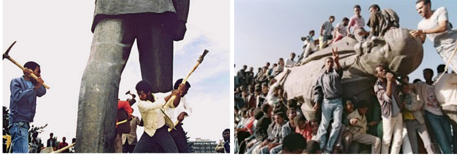
Görsel 6. Etiyopya'da devrilen Vladimir Lenin Anıtı

Mengistu Haile Mariam'ın sürgünden ayrılmasından iki gün sonra 23 Mayıs 1991'de Addis Ababa'daki Rus Bolşevik devrimci lider Vladimir Lenin'in heykelini sökmüşlerdir. Kitle daha sonra devrilen Vladimir Lenin heykelinin üzerine çıkarak yeni yönetim lehinde tezahürat yapmıştır (Görsel 5).