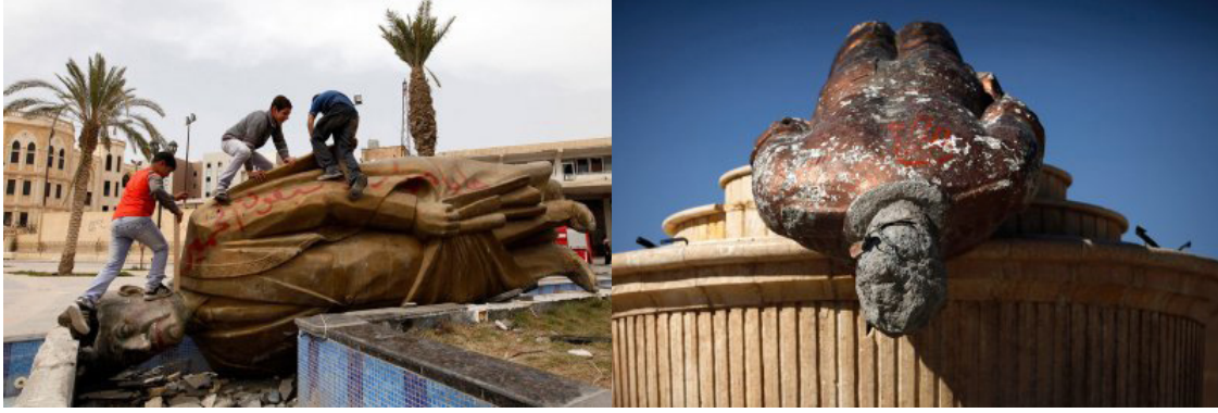
Görsel 14. Suriye'de yıkılan Esad Heykelleri, 2013

Yukarıda sıralanan örneklerden de anlaşılacağı üzere, 2000'li yıllarda Irak başta olmak üzere Ortadoğu coğrafyasında gözlemlenen, akabinde Arap Baharı ile Mısır ve Suriye gibi ülkelerin kent meydanlarına konumlandırılan anıtsal nitelikteki heykellerin muhalif halk kitleleri tarafından devrilmesi daha önceki heykel yıkım olaylarıyla bir hayli benzerlik taşımaktadır. Geçmiş döneme ait referanslar taşıyan anıtların yıkımına yönelik yapılan saldırılar, heykelin devrilmesinden çok daha büyük anlamlarla yüklüdür. Meselenin özüne bakıldığında söz konusu örnekler Orta ve Doğu Avrupa ülkelerinde yıkılan heykellerden çok da farklı bir anlam içermemektedir. Meydanlarda var olan anıtların yıkımı ile açıkça önceki rejim ve temsilcilerinin itibarsızlaştırılması ve yok sayılması amaç edinilmektedir. Bu manzaralar da batıdaki örneklerde olduğu gibi bir dönemin kapanışının ve yeni bir dönemin başlangıcının görsel birer yansıması olarak değerlendirilmelidir.