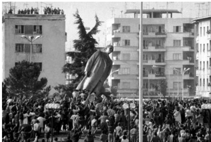
Görsel 6. Devrilen Tiran Enver Hoca' Anıtı üzerindeki Göstericiler

Özellikle yirminci yüzyıl sonrası döneme denk gelen tek parti hükümetleri ve tek adam rejimlerinden kalma Stalin ve Lenin heykellerine yapılan yıkıcı/yok edici müdahaleler gibi pek çok tek partili dönem yöneticisinin heykellerine de sert müdahaleler olmuştur. Bunlara yıkılan Yugoslavya'nın Tiran Kentindeki Enver Hoca'nın oldukça büyük boyutlu bronz heykeli örnek gösterilebilir. 20 Şubat 1991 tarihinde yaşanan olaya ait görselde Arnavutlara ait olduğu kabul edilen, Tiran özelinde Komünist rejimin son sembolü olarak tasvir edilen liderin heykeli toplanan kalabalık halk kitlesi tarafından kaidesinden zorla ayrılıp, kaldırılırken binlerce kişinin çevredeki binaların çatılarından tezahürat yaptığı gözlenmektedir (Görsel 6).