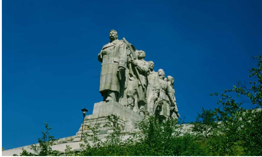
Görsel 2. 1955'te açılıp ve 1962'de yıkılan Prag Letná Park Stalin Anıtı, Fotoğraf: Getty Images