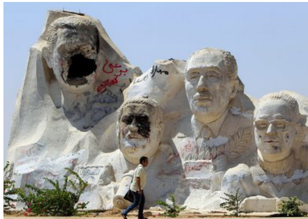
Görsel 12. Kahire Mısırlı Ahmed Zewail, Enver Sedat, Necib Mahfouz ve eski Mısır Devlet Başkanı Hüsnü Mübarek'in yer aldığı tahrip edilmiş Anıt, 2011

Kırık heykeller ve tahrip edilmiş portreler, Irak olaylarından yıllar sonra Arap Bahar'ında belirgin bir şekilde bir daha ortaya çıkmaktadır. Bu hareket barışçıl değişimin habercisi olmamıştır. Olaya Mısır özelinde bakıldığında zaman, Ocak 2011'de protestocular ve isyanlar ülkeyi sarsarken kuzeydeki İskenderiye kentinde Mısır'ın o zamanki Devlet Başkanı Hüsnü Mübarek'in portresinin parçalanmasının bir başka heykele müdahale örneği olduğu görülmektedir. Mısırlı Nobel ödüllü Ahmed Zewail, son Mısır Devlet Başkanı Enver Sedat ve Mısırlı romancı ve Nobel Ödüllü Necib Mahfouz ve eski Mısır Devlet Başkanı Hüsnü Mübarek'in yer aldığı Kahire'nin eteklerinde konumlandırılan dev anıt büyük ölçüde tahrip ve tahrif edilmiştir (Görsel 12). Yaşanan olaylardan ve söz konusu heykele saldırıdan haftalar sonra Devlet Başkanı Hüsnü Mübarek istifa etmiş, onun yerine seçilen selefi Muhammed Mursi'nin iktidarı ise, ancak bir yıl sürmüştür.