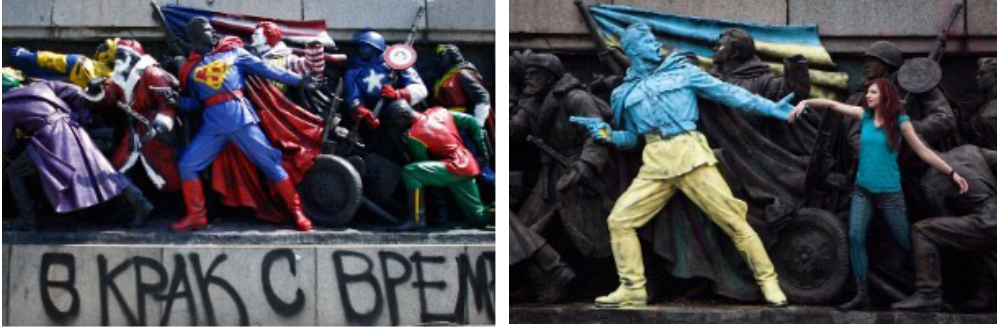
Görsel 8. Sofya Sovyet Ordusu Anıtı'na yapılan müdahaleler, 2011-2014

Ukrayna'da ise son dönemde sökülen binlerce Lenin heykeli benzer kaderi paylaşmış, bazılarının üzeri boyanmış, bazıları paramparça olmuş, bazıları ise bodrum katlarında saklanmış. Daha yakın tarihli bir yıkım eylemi ise 8 Aralık 2013'te Kiev'de görülmektedir. Kent meydanında bulunan taş bir Lenin heykeli, Avrupa Birliği entegrasyon destekçileri tarafından düzenlenen bir miting sırasında protestocular tarafından devrilmiştir. Dönemin Ukrayna Cumhurbaşkanı Viktor Yanukoviç'e ve onunla daha yakın ilişkiler kurma planlarına karşı düzenlenen kitlesel Euromaidan protestoları sırasında kalabalıklar heykeli çekiçlerle saldırmıştır. Ukrayna birlikleri ile Rus destekli ayrılıkçılar arasında devam eden çatışmalar sırasında Lenin heykelinin protestocular tarafından devrilmesinden sonra bu tahribata insanların bir kısmı büyük tepki göstermiştir. Anıtı onurlandırmak için yaşlı bir adamın heykelin üzerine çiçek bırakması ise oldukça dikkat çeken bir ayrıntı olmuştur (Görsel 9).