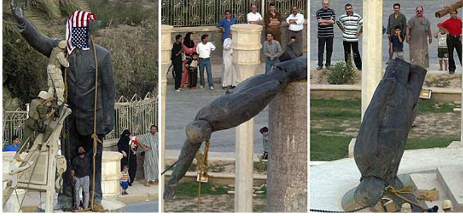
Görsel 10. Bağdat Firdos Meydanı, Saddam Hüseyin Heykelinin ABD Deniz Kuvvetlerince başına Amerikan bayrağı Geçirilme ve Yıkılma Anı, 2003