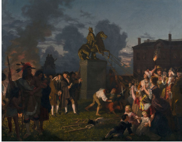
Görsel 1. Johannes Adam Simon Oertel'in 1776'da Britanya Kralı III. George'un heykelinin yıkımını tasvir ettiği tablosu

Yıkılan heykellerin görsel bir dokumanı olma bağlamında kaydedilen en eski örneklerden biri 1776 yılında Birleşik Krallıkta Bağımsızlık Bildirgesi'nin onaylanmasından sonra askerler ve sivil halk tarafından yıkılan Manhattan'daki Britanya Kralı III. George'un heykelidir. 19. yüzyılın ortalarından kalma bu resimde İngiliz ressam Johannes Adam Simon Oertel'in heykelin yıkım anını ölümsüzleştiren bir resmi betimlemektedir (Fortin, 2017, s.1).