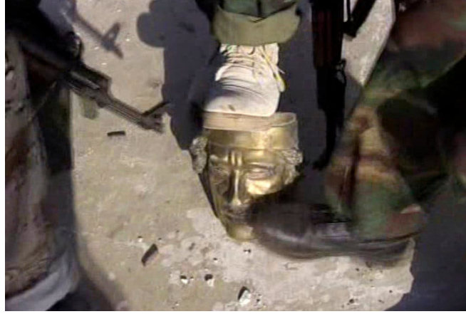
Görsel 13. Libya eski Devlet Başkanı Muammer el-Kaddafi'nin Yıkılan Anıtı, 2011, Fotoğraf: Associated Press

Arap Baharı kapsamında ele alınabilecek bir başka heykel yıkım olayı ise 23 Ağustos 2011 tarihinde Libya'da yaşanmıştır. Libyalı silahlı milisler ve isyancılar dönemin Devlet Başkanı Muammer el-Kaddafi'nin Trablus'taki Bab al-Azizia yerleşkesini ele geçirmişlerdir. İsyancılar orada bulunan ve Kaddafi'nin betimlendiği heykeli kaidesinden ayırarak başını sökmüş ardından koparılan başı ayakları altına alarak bu yıkıma ait fotoğraf ve görüntülerini bir başarı göstergesi olarak dünyaya servis etmişlerdir (Görsel 13). Bu eylem de diğer örneklerde olduğu gibi eski liderin itibarsızlaştırılmasının bir formu olarak ortaya çıkmaktadır. Yaşanan olaydan iki ay sonra Kaddafi öldürülmüştür. Ancak ülkedeki çatışma ortamı ve siyasi kaos devam etmekte ve kargaşa güncelliğini yitirmemektedir.