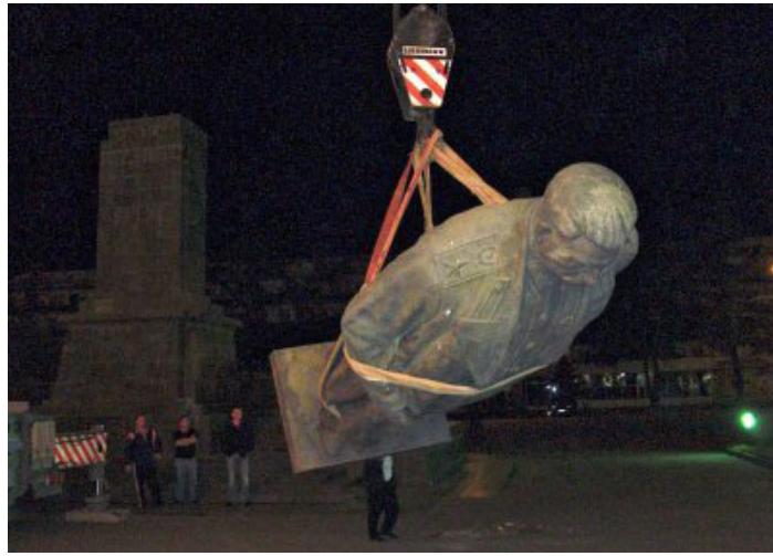
Görsel 7. Gürcistan Gori merkez meydanında kaidesinden ayrılan bronz Stalin Heykeli

Takvimler 25 Haziran 2010'u gösterdiğinde, Sovyet lider Josef Stalin'in Gürcistan'daki memleketi Gori'nin merkez meydanındaki dev bir bronz heykelinin de kaidesinden ayrılarak devrildiği görülmektedir. Anıt, Gürcistan'ın Rusya ile beş günlük bir savaşı kaybetmesinden iki yıl sonra, Batı yanlısı Cumhurbaşkanı Mikheil Saakashvili tarafından Sovyet döneminden kalma anıtlara yönelik baskı sırasında yıktırılmıştır. Ancak bu anıtın akıbeti diğer yıkılıp parçalanan heykeller gibi olmamıştır. Kasaba yetkilileri heykelin kaldırılıp kaldırılmaması konusunda bir referanduma gitmiş daha sonra heykelin kasabanın Stalin Müzesi'ne dikilmesi yönünde çoğunluk sağlanarak heykel müzede konumlandırılmış ve muhafaza edilmiştir (Görsel 7).