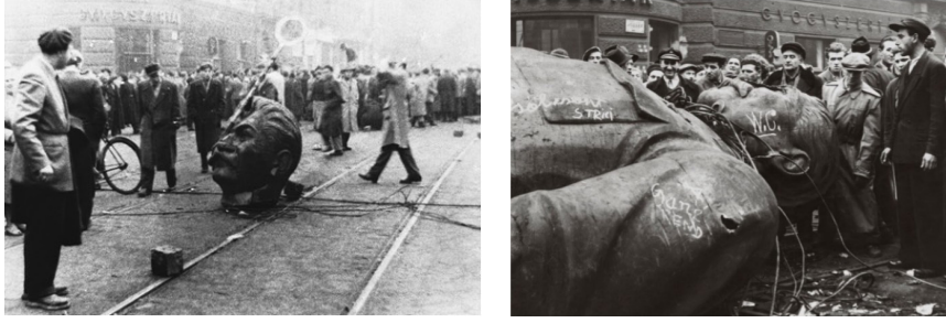
Görsel 4. Devrilen Bükreş Stalin Anıtı, Fotoğraf: Andor D. Heller/Hungarian News Agency

Rus Bolşevik lider Vladimir Lenin'in de Asya ve Avrupa başta olmak üzere kıtalar boyunca heykellerinin dikildiği bilinmektedir. Joseph Stalin heykelleri gibi bu heykellerin de çoğu, Romanya, Özbekistan ve Etiyopya gibi ülkelerde, Sovyet bloğunun çöküşü sırasında kaldırılmıştır. Tarihin her döneminde olduğu gibi dikildiği dönemde söz konusu anıtlar ile o yılların güçlü sivil ve siyasi tutkularına tanıklık edilmesi amaçlanmaktadır. Ancak sonraki dönemlerde temsil özelliği taşıyan heykellere müdahaleler hız kazanmıştır. Lenin heykellerine yapılan ilk müdahalelerden birisi 5 Mart 1990 tarihinde Romanya komünist lideri Nikolay Çavuşesku ve karısı Elena Çavuşesku'nun kurşuna dizilmesinden yaklaşık üç ay sonra Bükreş'te bulunan Rus lider Vladimir Lenin'in anıtsal boyutlu heykelinin devrilmesidir (Görsel 5). Oldukça kalabalık bir kitle tarafından iş makineleri ve halatlar kullanılarak kaidesinden ayrılarak yıkılan heykelin üzerinden halk protesto gösterilerine devam etmiştir.