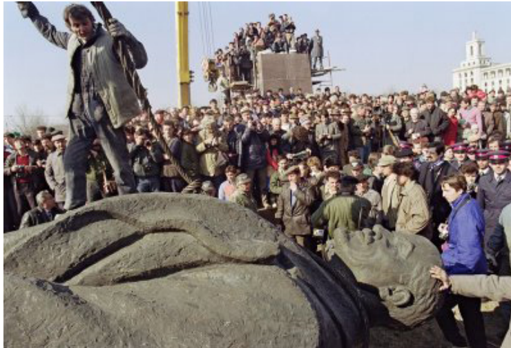
Görsel 5. Devrilen Bükreş Vladimir Lenin' Anıtı, Fotoğraf: Associated Press

Rus Bolşevik lider Vladimir Lenin'in de Asya ve Avrupa başta olmak üzere kıtalar boyunca heykellerinin dikildiği bilinmektedir. Joseph Stalin heykelleri gibi bu heykellerin de çoğu, Romanya, Özbekistan ve Etiyopya gibi ülkelerde, Sovyet bloğunun çöküşü sırasında kaldırılmıştır. Tarihin her döneminde olduğu gibi dikildiği dönemde söz konusu anıtlar ile o yılların güçlü sivil ve siyasi tutkularına tanıklık edilmesi amaçlanmaktadır. Ancak sonraki dönemlerde temsil özelliği taşıyan heykellere müdahaleler hız kazanmıştır. Lenin heykellerine yapılan ilk müdahalelerden birisi 5 Mart 1990 tarihinde Romanya komünist lideri Nikolay Çavuşesku ve karısı Elena Çavuşesku'nun kurşuna dizilmesinden yaklaşık üç ay sonra Bükreş'te bulunan Rus lider Vladimir Lenin'in anıtsal boyutlu heykelinin devrilmesidir (Görsel 5). Oldukça kalabalık bir kitle tarafından iş makineleri ve halatlar kullanılarak kaidesinden ayrılarak yıkılan heykelin üzerinden halk protesto gösterilerine devam etmiştir.