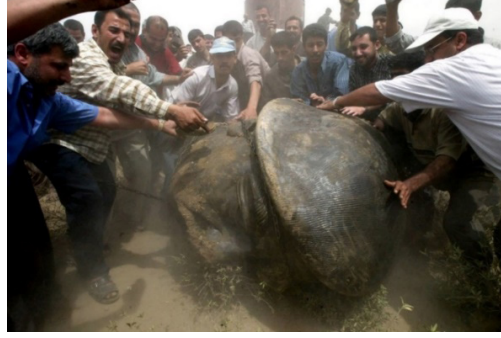
Görsel 11. Bağdat Firdos Meydanı, Saddam Hüseyin Heykelinin başını parçalamaya çalışan kalabalık, 2003

O döneme ait medya raporları askerlerin, heykel kütesinin aşağı çekilmesine yardım ettiğini yazsa da böylesi bir görüntünün çekiciliği henüz fethedilmemiş bir bölgenin hâkimiyeti anlamını da doğurmaktadır. Yıkımın yaşandığı gün orada basın muhabiri olarak görev yapan The New York Times Magazine gazetecisi Peter Maass'ın (2011, s.1) ifadeleriyle, bu yıkım Amerikan ordusunun en başından beri büyük bir gösteri sergilemek gibi harika bir fikri olmasından kaynaklanmaktadır ve heykelleri yıkan sadece Amerikan askerleri değildir, "tarih boyunca işgalci orduların yaptığı budur, bir ülkeyi işgal edersiniz, karşı olduğunuz rejimin temsilcilerini yerle bir edersiniz."