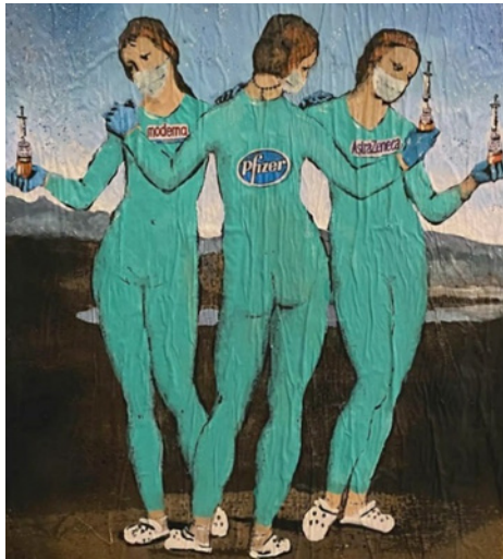
Görsel 9. TV Boy, Üç Aşıçılar, Three Vaccinators . 2020

Covid-19 salgını sürecinde sanatçıların üretimlerinde disiplinlerarası bir