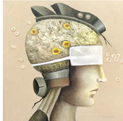
Görsel 6-7. Carmen Aldunate, Covid Serisi, Covid Series. 2020

Klasikleşmiş temaları ve kompozisyonları, güncel temalar etrafında yorumlayan bir diğer sanatçı TV Boy (d.1980) takma ismiyle tanınan İtalyan