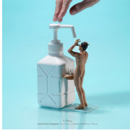
Görsel 3. Tatsuya Tanaka, Kendini Korum, Protect Yourself . 2020

şişesinin altında ve bu kimyasal madde ile yıkandığı anlaşılan erkek figürü izleyiciye göstermektedir. Yıkanan/lar teması Antik dönem, Rönesans ya da Modern Sanat tarihi içinde, sanatçılar tarafından tercih edilen bir kompozisyon olarak yer bulmuştur (Görsel 4). Çağdaş sanatçı Tanaka sanat tarihinde klasikleşmiş yıkanma temasını güncel sosyolojik dinamiklere bağlı kalarak yorumlamıştır.