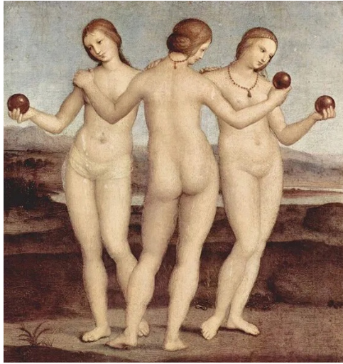
Görsel 8. Sanzio da Urbino Raphael, Üç Güzeller, The Three Graces , 1504-1505