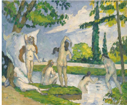
Görsel 4. Cezanne, Yıkananlar, The Bathers . 1874-1875