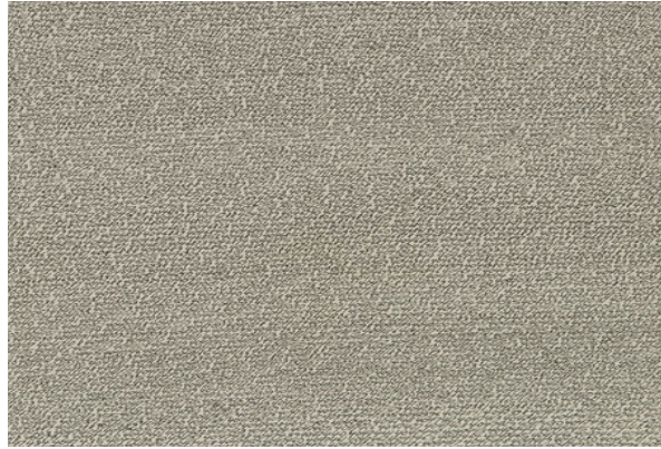
Görsel 4. Roman Opalka, Sonsuzluk Detay. homohminiupus.com/roman-opalka (Erişim Tarihi: 7 Nisan 2020)

Sanatçının eserlerinde, her sayı zamanın belli bir anını, geri döndürülemez izini taşır. Tüm yaşamı boyunca siyah ve beyazı kullanarak yaptığı her sayının, (Görsel 3) monotonluk şöyle dursun, farklı bir şey anlattığını fakat sayıların, her zaman insana değişken ve dinamik bir şeyler verebileceğini düşünür. Çünkü ona göre insan da değişken bir canlıdır.