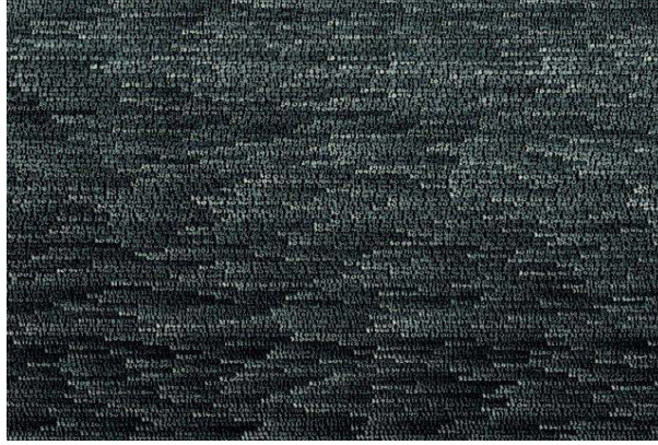
Görsel 3. Roman Opalka, 1965 / 1- a 120x90 cm, Sonsuzluk- Detay. Baskiloji.com/kanvas-tablo/78 (Erişim Tarihi: 15 Kasım 2020)

Sanatçının eserleri, sessiz yazma, bir duraklama, formun tekrarı ve boş bir alanı dolduran zamanı aksatacak zihinsel bir müdahale gibidir. Birbirini takip eden ardışık sayılar, sürenin inşası, insanı kucaklayan ve içine alan ondan ayrılmadan yaşadığı evrensel zamanın değerini içermektedir. Opalka'ya göre; yaptığı her eser “zaman, yaşam ve ölümün ilerleyişine özgü felsefi ve ruhani bir imgedir” (Altuğ, 2001).