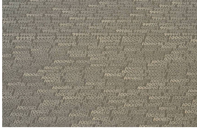
Görsel 6. Roman Opalka, Sonsuzluk Detay , 1965.

Opalka'nın sözlerinden de anlaşıldığı gibi insan, sonsuzu yaşayabilen sonlu bir varlıktır. Sonsuz sayıdaki sonlu, sonludaki sonsuzdur.