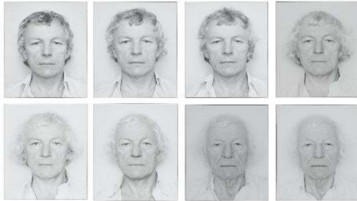
Görsel 5. Roman Opalka, Dört Eser: Opalka 1965/1-Sonsuzluk 5344592. google.com/search?q=romanopalka (Erişim Tarihi: 14 Kasım 2020)

1972 yılında "1000 000"a geldiğinde başlangıçta tamamı siyah olan tuvaline her yeni resminde beyazın %1'ini katmaya başlar. Sanatçının eserinde fon, böylelikle gitgide beyazlaşır, (Görsel 4) akan zamanı kendince yeni bir biçimde yaratır. Opalka sürekli beyazın tonlarıyla oynar. Sanatçı 1972 yılından ölümüne kadar, tuvaline aktardığı sayıları, aynı zamanda sesli olarak da ifade eder. Çalışması sonunda yazdığı sayıları, yüksek sesle söyleyip kaydeden sanatçı, günün sonunda eserinin ve kendi yüzünün (Görsel 5) zaman içindeki değişimini fotoğraf yoluyla ölümsüzleştirir. Yaşadığımız zaman ve yarattığımız zamanla, kayboluşumuzun somutlaştığını dile getirerek, aynı anda hem hayatta hem de ölüm karşısında olduğumuzu ve tüm canlıların gizeminin bu olduğunu öne sürer (Altuğ, 2001). Sanatçı kuşkusuz, hem imajının ve zamanla değişen sesinin kaydını kullanarak bir memento morinin doğası hakkında evrensel bir mesaj iletir. Bu şekilde kendi zamanının bedeninde yarattığı dönüşümleri izler. Sanatçının bu şekilde ürettiği tablolar başlangıcı ve sonu belirgin "1" den sonsuza giden doğrusal bir hareketin ayrıntıları haline gelir.