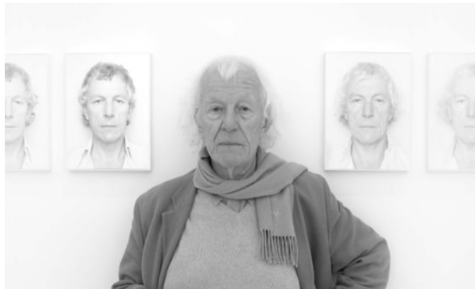
Görsel 1. Roman Opalka. (1931 / 2011) widewalls.ch/artists/roman-opalka (Erişim Tarihi: 24 Nisan 2014)

Günümüzde Kavramsal Sanat içerisinde anılan Polonyalı sanatçı Roman Opalka da, (Görsel 1) sonsuzluk teorisinden hareket ederek, eserlerinde sadece siyah ve beyaz kullanarak işler üreten bir sanatçıdır. Sanatçı eserlerini siyah ve beyaz üzerinden biçimlendirirken, matematikteki Galileo paradoksunda yer alan sonsuz sayılar, sonsuz noktalar ve sonsuz geri döndürülemez yöne doğru giden zamanın akışını görsel yoldan işleyerek oluşturmaktadır. Sanatı bir yaşam biçimine çevirmiş sanatçının, yaratım sürecinde biçimlendirdikleri, o güne dek geliştirdiği becerilerin, duyarlılıkların ve yaşadıklarının belirli bir ağırlıktaki yansıması olarak görülebilir.