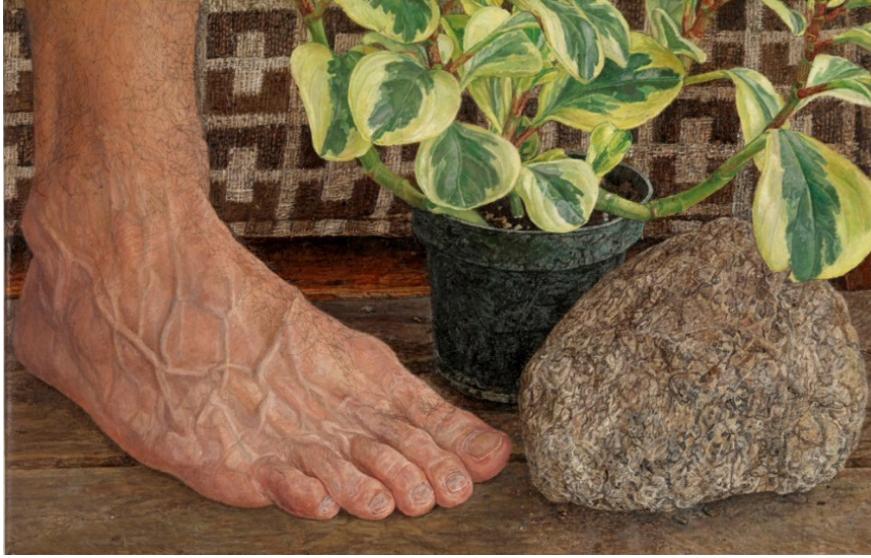
Görsel 7. Ellen Altfest, Kaya, Ayak ve Bitki , 2009, 22.9 x 35.6 cm, ONE2 Collection, USA.

Altferst bu resminde temsil durumunu; birey ve doğa ilişkisiyle ele almıştır. Baş ve Bitki isimli eserindeki gizleme yöntemi; bu eserde de (Görsel 7.) uygulanmıştır. Bedenin geri kalanı gizlenmiş ve ayak üzerinden bireyin kişiliği ortaya çıkarılmıştır. Dolayısıyla bireyin etrafındaki nesnelere; onun ruhsal durumuyla ilişkilendirildiğini gösterir. Eserlerindeki hiperrealist yönelim; nesne ve bireyin çözümlemesini ele aldığı içindir. Bu yüzden sanatçının eserlerinde, geleneksel ifade dilinin dışında bir anlatım yöntemine neden ihtiyaç duyduğu anlaşılmaktadır. Çünkü Altferst nesnelere kavramsal bir zemine oturmak istemektedir; bu nedenle kompozisyonun açılarını değiştirerek detayları ele almaktadır. Eser ebatlarını çoğu kez küçük tutarak; izleyiciye detayların önemini vurgulamaya çalışmaktadır. Sanatçı eserlerinde günlük yaşamdaki nesnelere; doğal ve anlık bir kurguyla ifade etmektedir.