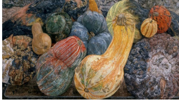
Görsel 3. Lucian Freud, Ayvalar , 1981-1982, Tuval Üzerine Yağlıboya,