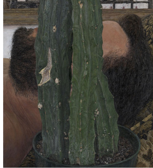
Görsel 5. Lucian Freud, Yaprakları ile Kız , 1948, Kâğıt Üzerine Pastel (Soldaki resim).