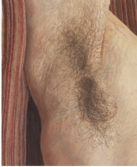
Görsel 8. Ellen Altfest, Koltuk Altı , 2011, 21.2 x 17.8 cm, Tuval Üzerine Yağlıboya,

yaşamdaki ilkel yanını göstermek için; nesnelere ile insan bedenlerini karşılaştırdığı ileri sürülebilir.