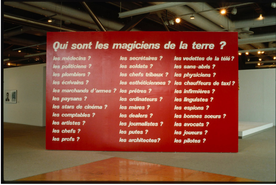
Görsel 5: Barbara Kruger, "Qui Sont les Magiciens de la Terre?" (Kimler Yeryüzünün Büyücüleri), panel resim, 1989. bit.ly/2YY70Bx

Hans Haacke'nın çalışması ise sergide gösterilen yapıtlar arasında post-kolonyal süreçte geliştirilen özeleştiril yaklaşımına dair en belirgin örneklerden biri olarak değerlendirilebilir (Görsel 6). Grande Halle de la Villette'deki aslanlı çeşmeye birtakım müdahalelerde bulunarak oluşturduğu bu yapıtı ismi üzerinden okuyabiliriz: One Day, The Lions of Dulcie September Will Spout Water in Jubilation (Bir gün Dulcie September'ın Aslanları Coşkuyla Su Püskürtecek). Güney Afrika'daki ırkçı Apartheid yönetimine karşı mücadele yürüten ANC'nin (African National Congress) Fransa'daki temsilcisi olan Dulcie September, 29 Mart 1988'de Paris'te bir suikast sonucu öldürülür. Sanatçı, September'a adadığı bu çalışmasını sembolik bir dille kurgulamıştır: Suyu akmayan çeşmenin ortasına konmuş Güney Afrika bayrağının yanı sıra, sarıya boyanmış aslanlar ve siyaha boyanmış havuzdaki su ile güç ve çatışmanın kaynağı olarak ülkedeki altın ve petrol temsil edilmiştir.