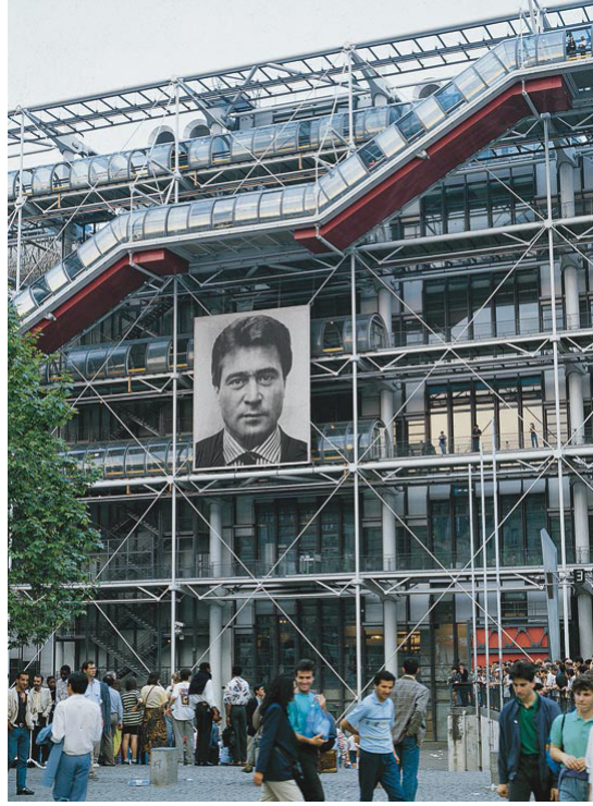
Görsel 4: Braco Dimitrijević, "Casual Passer-by I met at 3.59 pm" (Akşam üzeri saat 3:59'da oradan geçerken tesadüfen tanıştığım kişi), fotoğraf, 12x10 m, 1988. bit.ly/2PQc3Qz

Dimitrijević ise 1988 yılında Paris'te tesadüfen tanıştığı bir kişinin büyük boyutlu bir portresini aynı mekânın ön cephesinde sergileyerek (Görsel 4), ismini bilmediğimiz herhangi birinin de sanatın ve dünyanın merkezi olabileceğini vurgulamıştır.