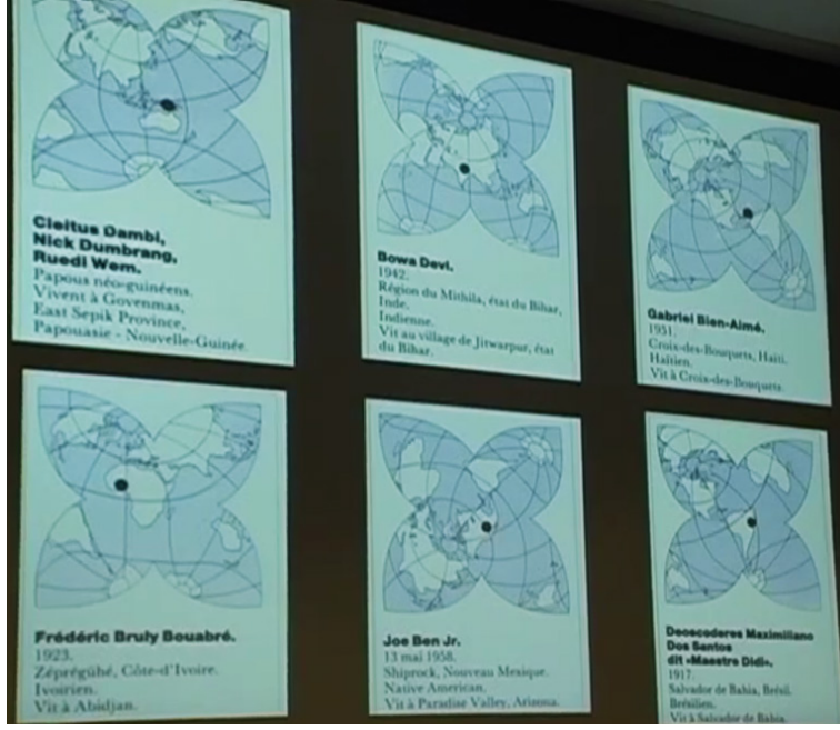
Görsel 2: Yeryüzünün Büyücüleri sergisinin kataloğundaher sanatçı için ayrı ayrı düzenlenmiş düzlemkürelerden birkaç örnek. bit.ly/2PLTEUW (video, dk:15, sn:10-20)