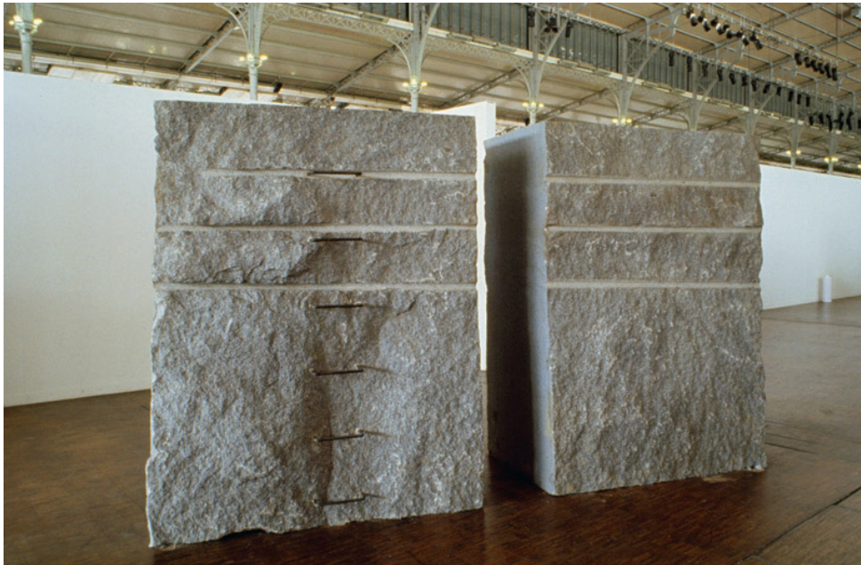
Görsel 8: Giovanni Anselmo, "To and Through The North" (Kuzeye Doğru ve Kuzeyin İçinden), ikiye bölünmüş granit monolit, 6 parça demir ve taş blok üzerine yerleştirilmiş 1 adet pusla, 1989. bit.ly/35Euuy0