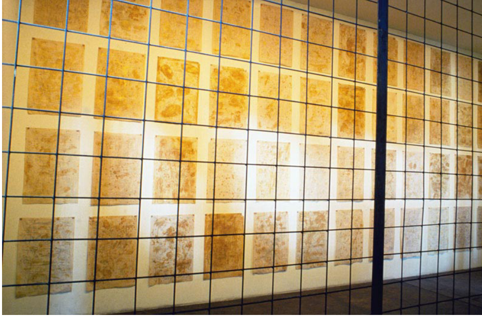
Görsel 7: Jean-Pierre Bertrand, "Volume de Perception au Seuil de l'imaginaire" (Hayal Gücünün Eşiğindeki Algılama Hacmi), 1989, demir parmaklıklar ardında duvar üzerine yerleştirilmiş, her biri 104x65 cm. ölçülerinde 12'şer parçadan oluşan dört sıra resim, kâğıt üzerine bal, limon ve füzen, kapladığı alanın ölçüleri: 5x7x10 m, bit.ly/35Euuy0