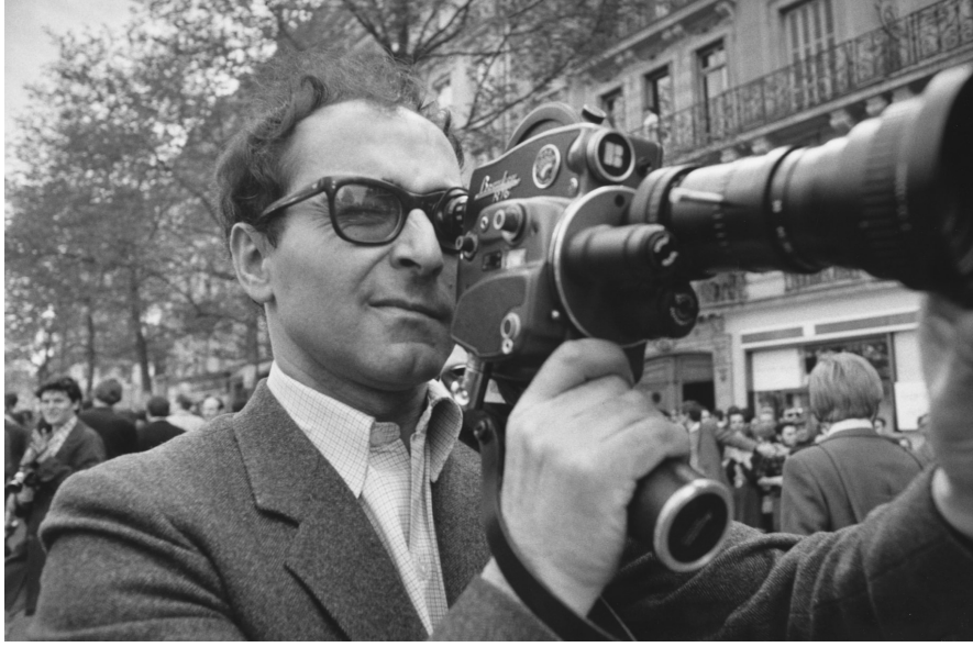
Görsel 1. Jean-Luc Godard'nın Fotoğrafı

Fransız Yeni Dalga akımı, estetik ve tematik açıdan sinemaya birçok yenilik getirmiştir. Truffaut, Resnais ve Godard gibi yönetmenlerin yapıtları geleneksel kalıpları kırarak, sinematografik anlatının sınırlarını genişletmişlerdir. Özellikle Godard, sinematografik anlatı öğelerinin her birini yaratıcı bir yöntemle kullanarak sinema estetiğinin gelişmesine büyük katkı sağlamıştır.