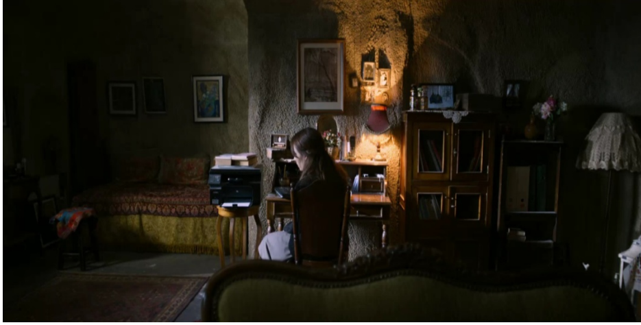
Görüntü 4. Nihal odasında yalnız başına oturuyor

Filmin temel anlatısında ışıklandırma teknikleri hem anlamın hem de duygunun oluşumunda çok önemli bir rol üstlenir. Bu noktada yönetmen sahnelerin içerisindeki duygu durumu ve karakterlerin iç dünyalarına paralel ışıklandırma teknikleri kullanır. Filmdeki ışık tasarımına dair bir diğer önemli unsur ise gün ışığı ve sarı ışığın iç mekân çekimlerinde beraber kullanılmış olmasıdır. Bu teknik bir yandan mekânın mimari yapısını ortaya çıkardığı gibi bir de filmde görüntüye estetik bir boyut kazandırmıştır. Buna örnek olarak filmin sonlarındaki şu kare gösterilebilir: