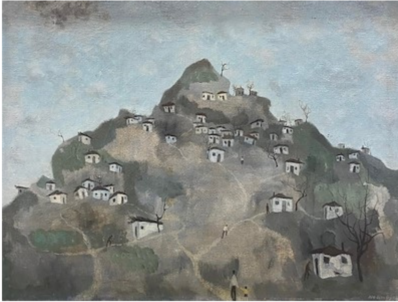
Görsel 6. Gecekondu Tepesi, Nedim Günsur-1924, 1994

Türk resminde toplumcu gerçeklik akımı 1960 sonralarında ortaya çıkmıştır. Soyut resmin sanat ortamlarında düzenli bir şekilde uygulanışı ve figüratif çalışmalar üreten sanatçıların kendi tarzlarını oluşturmasıyla sanat tarihinde yerlerini bulunmuştur. Neşet Günal, Nedim Günsur, Gürol Sözen ve Cihat Burak gibi toplumcu gerçekçi sanat anlayışıyla eserler üreten sanatçılar hem bireysel hem de toplu sergiler düzenleyerek sanatın ve ülkenin yaşantısına duydukları ilişkilerle durumu münakaşa ederek etkinliklerini devam ettirmişlerdir. Toplumcu gerçekçi anlayışta eserler üreten sanatçılardan Nedim Günsur 1960'lı yıllarda toplumsal temalara yönelerek On'lar Grubu içerisinde de çalışmalar göstermiştir. Soyut sanata Paris'te bulunduğu zamanlarda yönelim göstermiştir. Günsur'un üslubunda genellikle sert, geometrik bir biçim gözlemlenirken renk sektirmeyecek kasvetli bir yandan da göze hoş gelen uyum içerisinde eserler verdiği gözlemlenmiştir. Çalışmalarının yüzeyinde genellikle espas anlayış hâkim olmuştur (İnan, 2019, s.8,12)