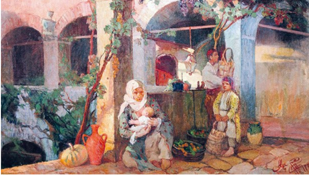
Görsel 1. Avluda Oturanlar, İbrahim Çallı-1913

Türkiye'nin modernleşme projesine bağlı olan Müstakiller adıyla bilinen bir grup daha çağdaş ve modern sanat anlayışını Türkiye'ye de taşımak için yoğun bir şekilde emek ve çaba sarf etmişlerdir. Batı'dan etkilenecek resimlerinde yeni biçimler denemişlerdir. Gelenekle çok alakaları olmasa da grubun çağdaş ressamı arasında yer alan Turgut Zaim'in resimlerinde çağdaşlarından farklı izlere de rastlanmıştır. Turgut Zaim teknik anlamda Batı resimlerine bağlı olsa da geleneksel Türk renk ve biçime olan hassasiyetini yansıtmaya isteğini de göstermiştir. Turgut Zaim çalışmalarında yerli unsurlara yer vererek minyatürü ve yöresel nakışı da uzun yıllar kendine has bir tarzda kararlı bir şekilde yansıtmıştır (Kılıç, 2001, s.328)