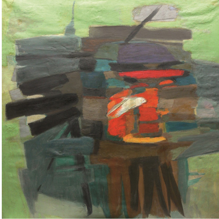
Görsel 7. Kompozisyon, Adnan Turani-1963

Soyut resim üreten sanatçılar figüratif resimler yapmaları dışında Non figüratif soyut çalışmalarda üretmişlerdir. Batılı sanatçılar kendilerine yeni ifadeler oluştururken Doğulu sanatçılar gelenek ve kültürlerini göz önünde bulundurarak Batılı sanatçıların bakışıyla çözümleyici sentezler elde etmişler kendilerine ait geleneği Batılının gözüyle keşfetmişlerdir (Yaşar, 2019, s.8)