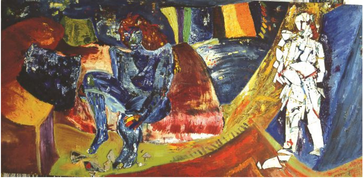
Görsel 9. Fahişenin Odası, Bedri Baykam-1981

1980'ler Türkiye'de ve dünyada büyük değişimlerin başladığı yıllar olmuştur. Türkiye'de 1980'lerde Plastik sanatlarda tuval resimleri artık geçerliliğini kaybetmeye başlamıştır. Yeni teknolojik imkânların kullanılmaya başlaması ve topluma yön vermeye başlayan yeni olgular öne çıkmıştır. Bu konuda Bedri Baykam'da çağdaş sanatın geçiş sürecinde önemli bir yer edinmiştir. Sanatçı tuval resimlerinde yenilik yapma arayışına girerek sınırları zorlamıştır. Sınırsız malzeme kullanımı ve sanatı yorumlamasıyla da dikkat çekmiştir. Yeni Dışavurumcu ifade biçimlerinin özelliklerini kullanarak çalışmaların zemininde yazı, fotoğraf, farklı nesnelere yerleştirme gibi ifade biçimlerini kullanarak farklı ve kavramsal yorumlar geliştirmişlerdir (Uz ve Uz, 2018, s.2,4).