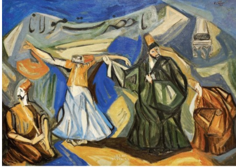
Görsel 3. Mevleviler , Cemal Tollu-1968