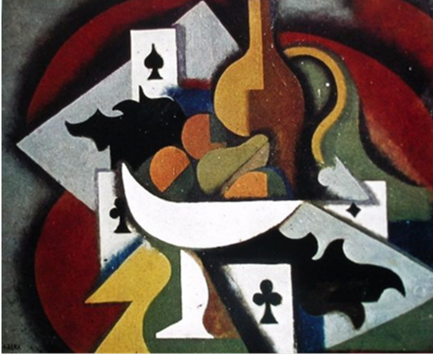
Görsele 4. İskambil Kağıtlı Natürmort, Nurullah Berk-1933

D Gurubu sanatçıları akademizmi yani tabiat taklitçiliğini reddetmişlerdir. Sanat manifestolarında klasizmi benimsemişlerdir (Berk ve Gezer, 1973, s.52).