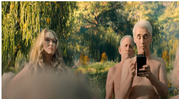
Görsel 23. Çıplak Şekilde Görülen Başkan ve Ekibi