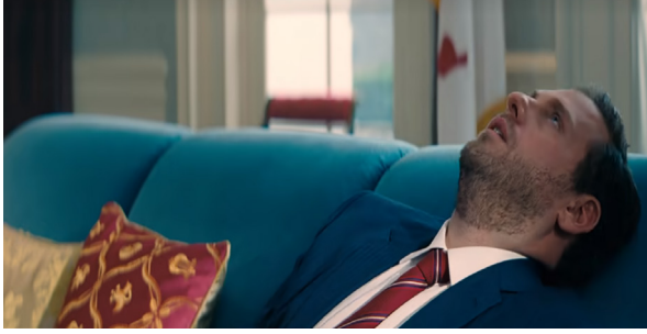
Görsel 7. Başkanın Oğlu