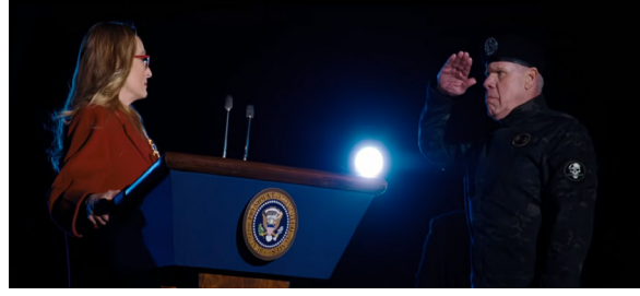
Görsel 14. Başkan ve Yaratılan Kahraman