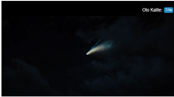
Görsel 21. Dünyaya Yaklaşan Kuyruk Yıldız

ve propaganda faaliyetlerinde bulunarak kitlelere yukarı bakmamaları yönünde telkinde bulunmaktadır (Görsel 19). Başkan yapmış olduğu açıklamalarda “Neden yukarı bakmanızı istiyorlar peki? Neden biliyor musunuz? Çünkü korkmanızı istiyorlar. Yukarı bakmanızı istiyorlar. Çünkü onlar size tepeden bakıyorlar.” şeklinde yaklaşan tehlikeyi, halkın korkmalarını istedikleri ve küçümsedikleri şeklinde yanılgılara bağlamakta, dolayısıyla da yaklaşan tehlikeyi (gerçeği) çıkarları doğrultusunda gizlemeye çalışmaktadır. Bu durum Başkanın siyasi ve bireysel çıkarlarına yaklaşan tehlikeleri bile göremeyecek/görmeyecek kadar bağlı olduğu mesajı vermesi açısından önemlidir. Başkanın insanların yukarı bakmamaları gerektiği şeklinde yapmış olduğu açıklamalar da sosyal medyada geniş bir yer bularak, filmin de adını da oluşturan Don't Look Up (2021) (Yukarı bakma) sloganının veya hareketinin yaygınlaşmasına neden olmaktadır. Bu noktada Başkanın bilim karşıtlığı bağlamında halk arasında nasıl bir ikilik yarattığı da hicvedilmektedir.