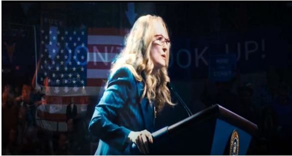
Görsel 19. Başkan