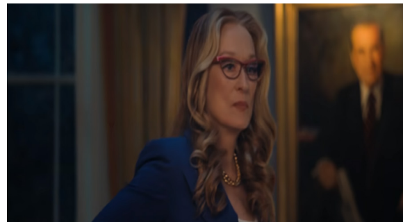
Görsel 12. Başkan

Siyasi mizahın konu edindiği bir başka sahne, Prof. Mindy, Dibiasky ve Dr. Oglethorpe'in polis zoruyla Beyaz Saray'a götürülmesi ve sonrasında Başkan Orleon'la yaptıkları görüşmenin yer aldığı sahnedir. İlgili sahnede Prof. Mindy, Dibiasky ve Dr. Oglethorpe, Başkan Orleon ve Jason'un bulunduğu ofiste görüşme