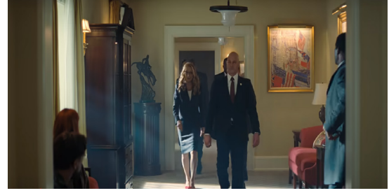
Görsel 2. Başkan ve Ekibi