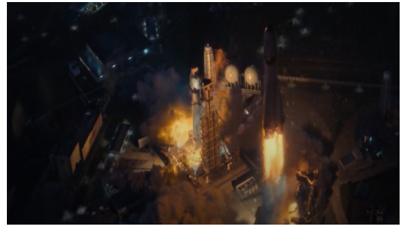
Görsel 22. Fırlatılan Roket