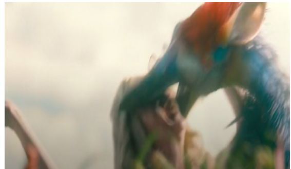
Görsel 24. Başkanı Yakalayıp Öldüren Yaratık

Siyasi mizahın konu edindiği sahnelerden diğer kesitler, Başkan yanlılarının iyice yaklaşan kuyruklu yıldızı görmeleri akabinde Başkan ve ekibini protesto etmeleridir. Bunun üzerine Başkan ve ekibi, kuyruklu yıldızı bertaraf etmek için roket