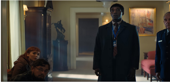
Görsel 3. Başkanı Bekleyen Grup