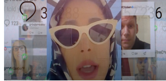
Görsel 18. Sosyal Medyada Yer Alan Bir Kare