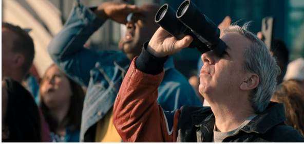
Görsel 17. Kuyruklu yıldız bakan insanlar

ve medyayı da yanına alarak bu profil doğrultusunda halkın desteğini almayı amaçlamaktadır. Fakat daha sonra Başkan kuyruklu yıldızın değerli madenlere sahip olduğunu fırlatma esnasında öğrenerek kuyruklu yıldız yörüngesinden saptırmaktan vazgeçer. Burada da Başkanın halkın gerçek sorun ve tehlikelerle ilgilenmediği kendi çıkarları doğrultusunda hareket ettiği mesajı verilmektedir.