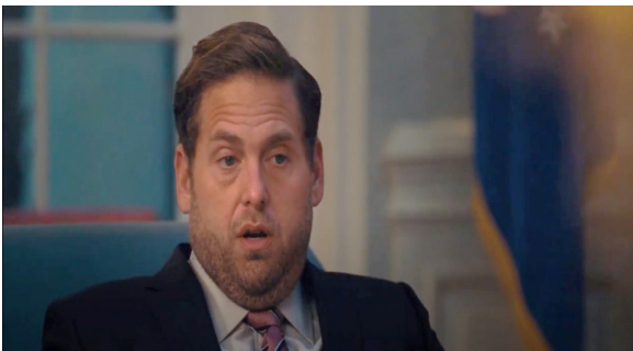
Görsel 11. Başkanın Oğlu