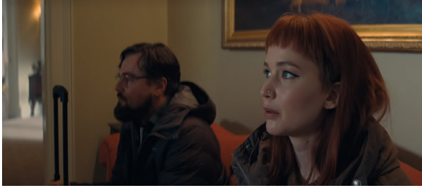
Görsel 1. Prof. Mindy ve Dibiasky

Yukarıdaki bilgilerin ışığında film, birbirinden farklı siyasi mizah barındıran ve gerçeklik algısını sorgulatan 24 sahnenin yol göstericiliğinden hareketle aşağıdaki şekilde analiz edilmeye çalışılmıştır.