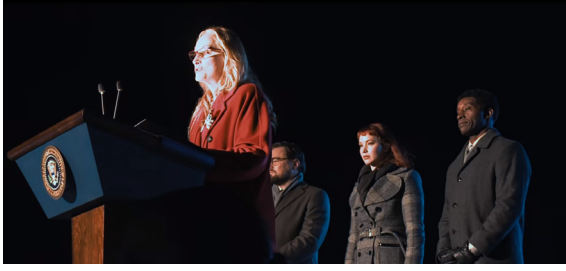
Görsel 13. Başkanın Halka Seslenişi