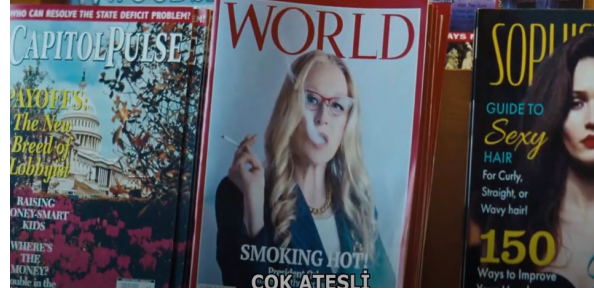
Görsel 16. Dergide Yer Alan Başkan Görseli

Siyasi mizahın konu edindiği sahneler, kuyruklu yıldız ve onun gezegene yönelik tehdit oluşturan yönünün Başkan Orleon tarafından gündem saptırma ve ara seçimleri kazanma amacına dönük olarak gerçekleştirdiği kampanyayla ilgili sahnelerdir. İlgili sahneler, düz anlam boyutunda değerlendirdiğinde Başkan Orleon, Prof. Mindy, Dibiasik ve Dr. Oglethorpe'in kuyruklu yıldız hakkındaki açıklamalarını, kendilerini de arkasına alarak televizyonlara açıklamalarda bulunmaktadır. Başkan, kuyruklu yıldızın yörüngeden saptırılması amacıyla birini görevlendirmekte, o kişiyi halka bir kahraman olarak tanıtmaktadır. Devam eden kampanya neticesinde, Başkan dergi kapaklarına çıkacak kadar ünlenmekte, halkın desteğini almaktadır. Sonraki sahnelerde yaratılan kahramanın içinde yer aldığı birçok sayıda roket, kuyruklu yıldız yörüngeden saptırmak için fırlatılmaktadır. Başkan, Prof. Mindy, Dibiasik, Dr. Oglethorpe'in de yer aldığı bir kontrol merkezinde roketin fırlatılmasını takip etmektedir. Medya, konuyu yakından takip etmektedir. Gerçeğin/hakikatin medya üzerinden saptırılması önem arz etmektedir. Çünkü çalışmanın kuramsal kısmında da ifade edildiği gibi, medya gerçeğin büyük halk kitlelerine ulaştırılmasında başrolde yer almaktadır. Asıl görevi halkı doğru bilgilendirmek olan medya, bazı siyasi saiklerden hareketle doğru olanı değil saptırılmış olanı halka sunabilmektedir.