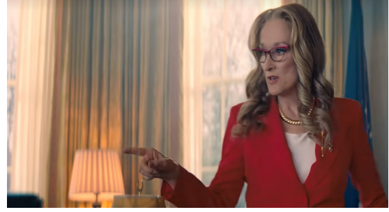
Görsel 8. Başkan

Siyasi mizahın konu edindiği ikinci sahne, Prof. Mindy, Dibiasky ve Dr. Oglethorpe'in Başkan Orlean ile gerçekleştirdikleri görüşmedir (Görsel 5). İlgili sahne, düz anlam bağlamında değerlendirildiğinde Prof. Mindy, Dibiasky ve Oglethorpe Başkanın odasında görüşme için hazır bulunmaktadır. Başkan ve yanındakiler ise kendilerini dinlemekte, anlatılanlar karşısında çeşitli tepkiler vermektedirler.