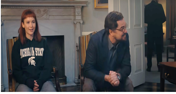
Görsel 5. Prof. Mindy ve Dibiasky