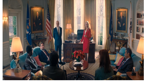
Görsel 6. Başkan ve Bilim Adamları