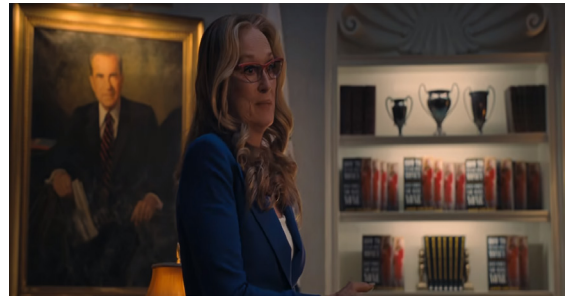
Görsel 10. Başkan