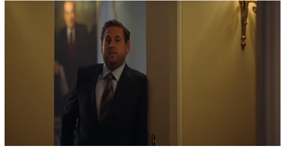
Görsel 4. Başkanın Oğlu

Siyasi mizahın konu edindiği ilk kare, Beyaz Saray'daki sahnedir. İlgili sahne, düz anlam bağlamında ele alınmıştır. Sahnede, Beyaz Saray'ın bir koridorunda iki kişi oturmaktadır. Bunlardan biri Profesör Randall Mindy, astronomi doktorası adayı Kate Dibiasky'dir. Bu kişiler, Amerika Birleşik Devletleri (ABD) başkanı Janie Orlean'a kuyruklu yıldız ve onun dünyaya yönelik etkilerini anlatmayı beklemektedirler (Görsel 1). Bir süre sonra Başkan ekibiyle beraber koridorda görünür. Mindy ve Dibiasky'nin yanında duran NASA'nın Gezegenel Savunma Koordinasyon Ofisi başkanı Dr. Oglethorpe, Başkana ve ekibine görüşme talebinde bulunur. Fakat Başkanın ekibinden bir görevli, önemli bir sorun olduğunu, beş dakika izin vermesi gerektiğinin belirtir. Akşama kadar bekleyen ekibe, Başkanın oğlu ve aynı zamanda Beyaz Saray Sekreteri Jason Orlean, görüşmenin bu akşam gerçekleşmeyeceğini iletir.