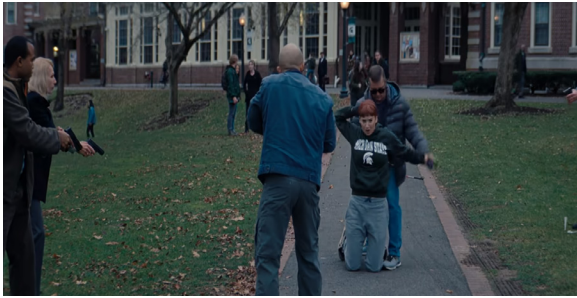
Görsel 9. Dibiasky'nin Tutuklanması

zamanlarda ise yükseldiğinden bahisle mevcut durumla ilgilenmesinin kendisine herhangi bir çıkar sağlamayacağı mesajı vermektedir. Anlatılan durumun geçmişteki kıyamet senaryolarından ya da sıradan şeylerden farkı olmadığını ifade etmekte ve yapacağı işleri olduğu gerekçesiyle görüşmeyi sonlandırmak istemektedir. Ekibin açıklamaları ise hiçbir işe yaramamaktadır. Ekibin devam eden ısrarlı açıklama ve uyarılarına karşılık bu durumu ciddiye aldığını ve kendisini çok üzdüğünü ifade eden Başkan, sonrasında kayıtsız tavırlarına devam etmektedir. Tüm bu bilgiler ışığında ilgili sahne yan anlam bağlamında; Başkanın halkın gerçek sorunlarıyla ilgilenmediği, halka yönelik tehlikeleri göz ardı ettiği, bilim adamlarını ve var olan bilimsel gerçekleri kendi çıkarları doğrultusunda manipüle etmeyi düşündüğü ya da ettiği mesajı verilmektedir. Son olarak Başkanın siyasi bakış açısının ve tarzının Playboy dergilerinde yer alan kadınlardan farkının olmadığı da verilen mesajlar arasındadır. İlgili sahnede Jason'un "Açıkçası Playboy'da görmek isteyeceğim tek Başkan" şeklindeki açıklaması bu durumu yansıtmaktadır.