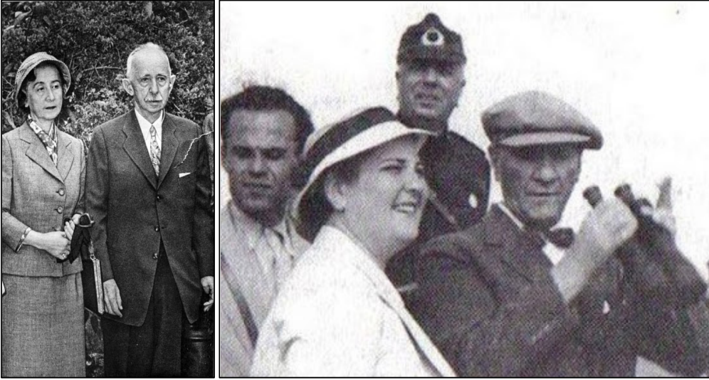
Görsel 12. Mevhibe İnönü ve Afet İnan

Cumhuriyet döneminde giyim-kuşamla ilgili düzenlemeler her ne kadar sadece erkekleri hedef alıyor izlenimi yaratsa da aslında Atatürk'ün büyük değer verdiği Cumhuriyet'in yeni yüzü, çağdaşlığın simgesi kadına çağdaş bir giyim-kuşam tarzı için çalışılmıştır. Bu nedenle Atatürk yakın çevresindeki kadınlarla işe başlamış, giyim kuşam konusunda öncü olmaları için eşi Latife hanım ve manevi kızları Afet İnan ve Sabiha Gökçen'i teşvik etmiştir. Ayrıca Atatürk'ün yakın arkadaşlarının ve yöneticilerin eşleri de Batılı giyim-kuşam tarzıyla Türk kadınına örnek olmuştur (Türkan, 2011, s. 179) (Görsel 12).