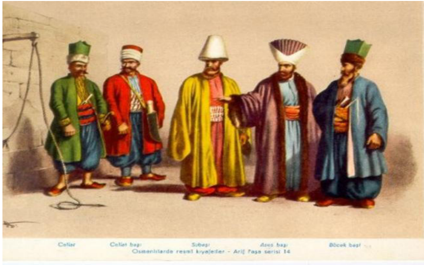
Görsel 2. Osmanlı resmi kıyafetleri (Yılmaz, 2015, s. 132)

Osmanlı İmparatorluğunda başa giyilen sark ve kavuklar şekliyle ve kumaşıyla kişinin sınıf ve mesleğine göre değişiklik göstermiştir (Görsel 2). Farklı renklerde ve biçimlerde sarılan sarıklar makama göre değişmiştir (Özer, 2014, s. 372). Osmanlı Saraylarında sultanlar giyim-kuşama çok önem vermişlerdir. Bu durumu İngiliz kadın seyyah, Leydi Mary Wortley Montagu'nun The Turkish Embassy Letters (Türkiye Mektupları) adlı eserinden yola çıkılarak Osmanlı İmparatorluğu'nda dönemin Saray çevresinin kadın ve erkek giyim kuşam ve başlık kültürü ve tercihlerini, Osmanlı İmparatorluğu saraylarına özgü erkek ve kadın giysilerini, yaşmak ve saç süslemelerini, paha biçilmez mücevherleri, kullanılan kumaş, malzeme ve renkleri ayrıntılı bir şekilde betimlemiştir (Gündüz, 2019, s. 122).