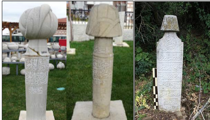
Görsel 1. Mezar taşı örnekleri (Kurtişoğlu, 2018; Hanoğlu, 2018)

Orta Asya Türklerinden itibaren Osmanlı İmparatorluğunda da giyim-kuşamda çok fazla değişiklik olmamasına rağmen börk, fes, hotoz, kalpak, kavuk, kukuleta, külah, miğfer, puşu, sarık, takke, taç, tas, tepelik ve üsküf gibi isimlerle çok çeşitli başlıklar kullanılmıştır. Türk kültüründe başlığa bu denli anlam yüklenmesinde Türklerin İslamiyet'i kabulünden sonra Müslümanların şekil ve görünüşte diğer toplumlardan ayrı olmasını istemelerinin rolü büyüktür (Arıç, 2006, s. 143; Kılıç, 1995, s. 529). Hatta kimliğini ifade etmek için ölen kişinin mezar taşlarına taktıkları başlıklarını yontmaları bunun en belirgin örneğidir (Vatandaş, 2016, s. 152). Böylelikle mezar taşları geçmişten geleceğe sosyal ve kültürel zenginliklerimizi aktaran önemli bir iletişim aracı haline gelmiştir. Örneğin Edirne mezar taşları, dönemin sanat anlayışına bağlı kalarak, kişinin dünyada bir kimliğe ihtiyacı kalmamasına rağmen daracık bir alanda pek çok bilgiyi (kimliği, statüsü, mesleği, ait olduğu tarikatı) sunabilme ve hayatını özetleyebilmesi bakımından oldukça ilginçtir (Görsel 1). Mezar taşları insanlarla öylesine özdeşleşmiştir ki, padişahların reformları bile mezar taşlarına yansıtılmıştır. II. Mahmut'un fesi başlık olarak kullanımını zorunlu tutmasıyla birlikte dönemin mezar taşlarında da bu başlık formu görülmektedir (Kurtişoğlu, 2018, s. 44).