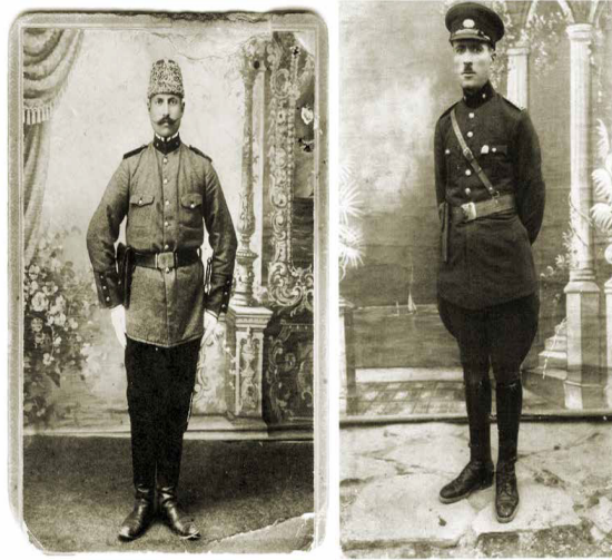
Görsel 9. Şapka kanunu sonrasında değişen polis memurlarının şapkaları (1913'ten 1928'e) (Yılmaz, 2015, s. 139-143)

Şapka kanunu, kadınları ve halkı kapsamamıştır. Sadece resmi görevlileri ve milletvekillerini kapsamıştır (Görsel 9). O dönemde tepki yaratmamak için kadınların giyimi konusunda peçe ve çarşafın yasaklanmasıyla ilgili herhangi bir yasa çıkarılmamıştır. Ancak kadınların modern giyinmeleri için destekleyici tavırlarda bulunularak, zaman içinde şapka kullanımı, gerek kadınlar gerekse halk kesimi arasında da yaygınlaşmaya başlamıştır.