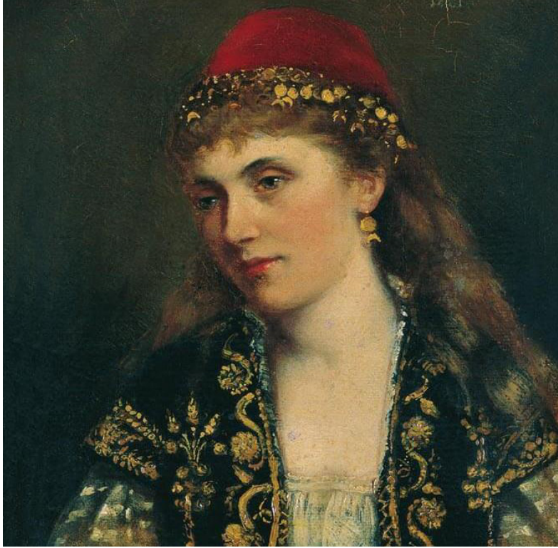
Görsel 7. Fesli Osmanlı Kadını