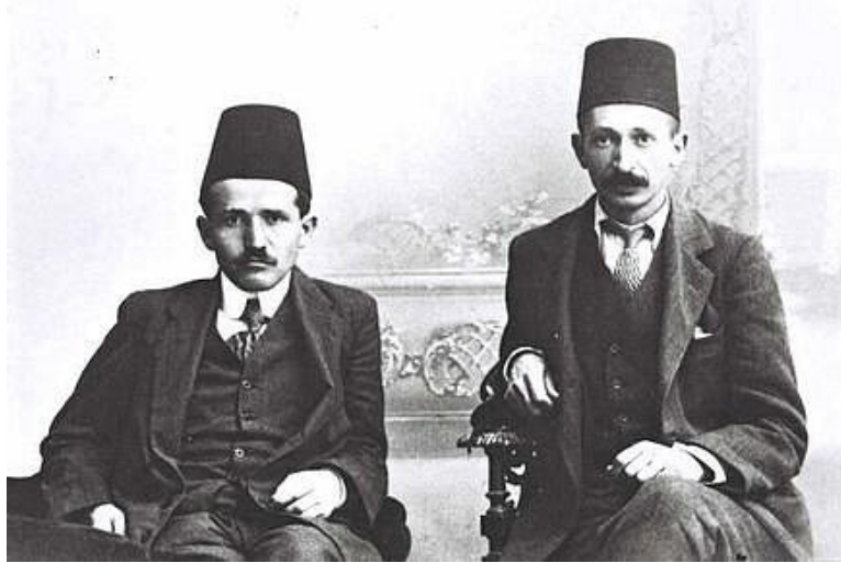
Görsel 5. İstanbul'da yaşayan Yahudilerin fes kullanımı (Erdemir, 2011)

1828 yılındaki Elbise Nizamnamesi sonrasında 1829 yılında kıyafet reformu sivilileri de kapsayacak şekilde genişletilmiştir. Bu düzenleme ile memurların sınıflarına ve vasıflarına göre kullanacakları giyim-kuşam detaylı olarak açıklanmış, cübbe ve sarık kullanımına yalnızca ulema sınıfı için izin verilmiştir. Ulema sınıfı haricindeki tüm sivililerde ise fes kullanımı zorunlu hale gelmiştir. Gayrimüslimler eşitliğin bir simgesi olarak gördükleri fes kullanımını memnuniyetle kabul etmişlerdir (Görsel 5) (Özkan, 2008, s.10).