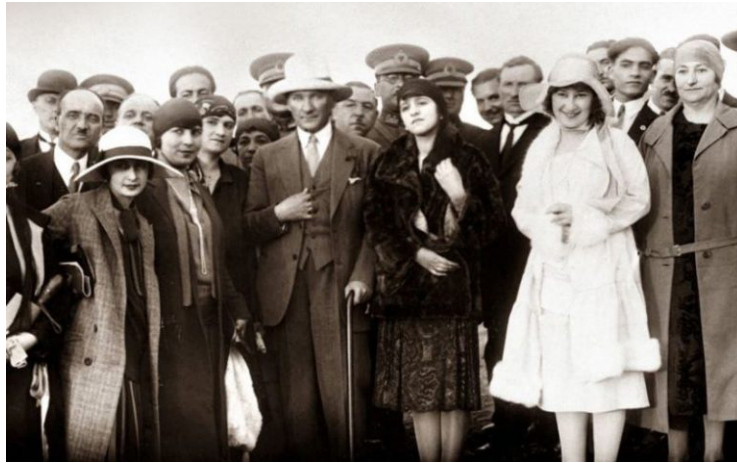
Görsel 8. 1 Eylül 1925 Kastamonu'da şapka inkılabından sonra Atatürk'ü Gazi Çiftliği'nde karşılayanlar (Şahin, 2005, s. 41)

Cumhuriyetin ilanının ardından 25 Ağustos 1925 tarihinde Mustafa Kemal Atatürk'ün Kastamonu ziyaretinde halkı şapka ile selamlamasından üç ay sonra, 25 Kasım 1925 tarihinde şapka kanunun yürürlüğe girmesiyle birlikte Cumhuriyet döneminde Batılılaşma için önemli bir adım atılmıştır. Atatürk'ün Kastamonu ziyaretinde halkı panama şapkası olarak bilinen geniş kenarlı beyaz bir şapka ile selamlaması ve ardından yapmış olduğu konuşmasında medeni serpuş, şems siperli serpuş şeklinde ifade ettiği şapka için, "...bu serpuşun adına şapka derler. Redingot gibi, bonjur, smokin gibi işte şapkanız..." sözü ile şapka kullanımı başlatmıştır. Kastamonu ziyaretinin ardından 1 Eylül 1925'te Atatürk Ankara'ya döndüğünde Atatürk'ü karşılayanların şapka takması, şapkanın halk tarafından da kabul gördüğünün bir göstergesi olmuştur. Şapka kanunu ile birlikte sarık ve fes gibi başlıkların yasaklanmasının ardından şapka resmi başlık haline gelmiştir (Görsel 8) (İtkib, 2020, s. 87; Türkan, 2011, s. 178).