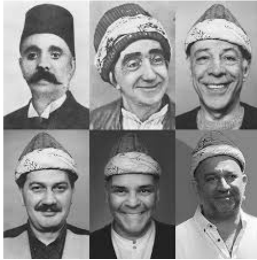
Görsel 13. Kel Hasan Efendiden günümüze kadar kavuğun yolculuğu

Türklerin kullandığı başlıklar arasında çok eski tarihlerden beri kullanılan kavuk ve fes, Türk tiyatrosu için önemli bir simge olarak kabul edilmiştir. Tiyatrodaki bu kavuk geleneği Meşrutiyet döneminde Kel Hasan Efendi ile başlamıştır. Kel Hasan Efendi'nin oynadığı orta oyunlarında giydiği kavuğu ve tuluat (güldürü) oyunlarında giydiği fesi bir simge haline dönüşmüştür. Kel Hasan Efendi'nin fes ve kavuğu Türk tiyatro oyunculuğu mirasını temsil etmektedir ve İsmail Dümbüllü'ye vermesiyle şimdi bile devam eden bir gelenek başlamış ve önemli bir miras olarak nesilden nesile aktarılmıştır (Durmaz, 2018) (Görsel 13).