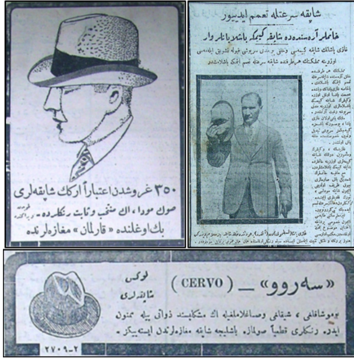
Görsel 11. 1925 tarihli Cumhuriyet Gazetesi'nde yer alan şapka reklamları, 5 Eylül 1925 tarihli Cumhuriyet Gazetesi'nde "Şapka Süratle Tamim Ediliyor" başlıklı bir haber (Özcan, 2008, s.109-110)

Şapka inkılabının kabul edilmesi ile İstanbul'da şapka satan ve yapan dükkânlarda aşırı kalabalıklar oluşmuştur. Şapka ihtiyacı karşılanmadığı için Avrupa'dan kep, kasket, fötr silindir gibi şapkalar ithal edilmeye başlamıştır. Şapka ve elbise almakta zorlanan memurlar için uzun vadeli borç verilerek, Karamürsel fabrikasında şapka imalatı hız kazanmıştır. İzmir'de şapka yapım merkezi kurulmuş, gerekli araç ve gereçlerin sağlanması için şapka yapımında incelemede bulunmak üzere; İtalya ve Avusturya ile Ticaret Bakanlığı ile irtibata geçilmiştir (Erdüğan, 2019, s. 67).