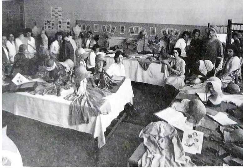
Görsel 6. Hanımlara Mahsus Gazete'nin terzihanesi (Karakışla, 2014, s. 35)

Batılılaşma hareketiyle birlikte Paris ve Londra'da esen moda rüzgârı İstanbul'da özellikle Beyoğlu ve Pera bölgesine yerleşmiş olan yabancı asıllı terziler ve Avrupa ile güçlü bağlantıları bulunan Osmanlı İmparatorluğundaki azınlıklara mensup terziler aracılığıyla Osmanlı kadınlarına ulaştırılıyordu. Modistre adı verilen bu Frenk terzileri dergilerde yayınlanan modelleri ve Avrupa'dan getirdikleri aksesuarlarla birlikte Osmanlı saray kadınlarına ve üst düzey ailelerin kadınlarına yüksek ücretlerle dikiyordu (Görsel 6) (Karakışla, 2014, s. 14).