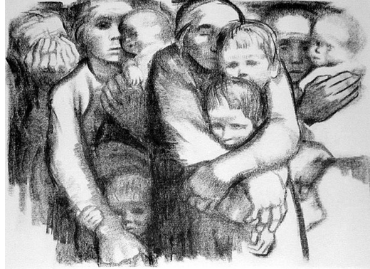
Görsel 9. Käthe Kollwitz, Anneler (1919) Litografi

Käthe Kollwitz, yapıtlarında annenin koruyuculuğunu vurgularken sanki fiziksel parçasıymışçasına deneyimlediği bir parça olarak duyduğu eksikliği yansıtır (Görsel 8, 9). Kollwitz için annelik geleneksel bakış açısının aksine kadını kamusal alandan ayıran sosyal bir görev ya da duygusal taraf değil, tersine kadını daha güçlü kılan bir deneyim ve duyarlılıktır.