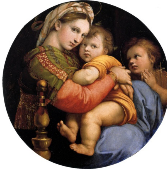
Görsel 1. Rafello, Madonna della Sedia (1512-1514)