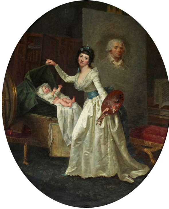
Görsel 3. Marie-Nicole Dumont, Çalışmaları Sırasında Sanatçı (1789), Tuval üzerine Yağlıboya, 54 x 44 cm.

Modern annelik ve Madonna temalarının bütünleşmesinin ilk defa 18. yüzyılın sonlarında Elisabeth Vigee Le Brun'nun 1787 Salon sergisinde sergilenen Rafello'nun Madonna della Sedia (1512-1514) (Görsel 1) eserinden esinlenen Juli ile Oto-portre (Görsel 2) isimli çalışmasında ortaya çıktığı söylenebilir. Bu dönem aynı zamanda annelik kültürünün ortaya çıktığı dönemdir (Fowle, 2002, s.10). Çağının beklentileri doğrultusunda annenin şefkat ve koruyucu yaklaşımını yansıtan bu resim, annelik sevgisinin en saf halini hissettir.