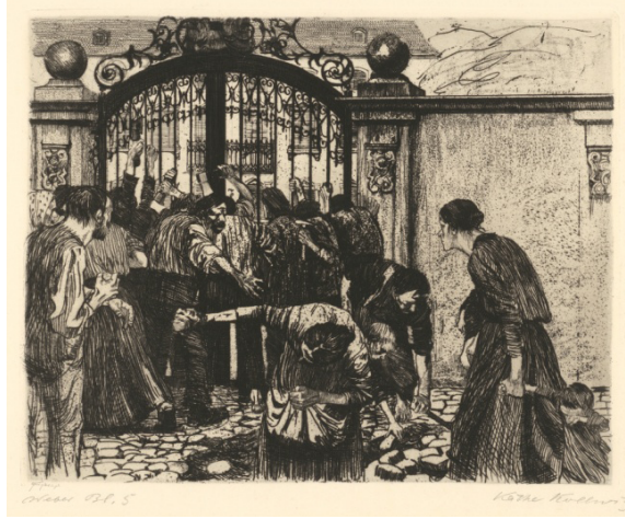
Görsel 10. Käthe Kollwitz, Ayaklanma (1899), Gravür, Kuru kazıma, Aquatint, 29,5x32,1cm

"Ayaklanma" adlı eserde kapının önünde bir grup işçinin ayaklandığını görüyoruz. Erkekler kapıya taş atmakta, kadınlar ise atılacak taşları toplamaktadırlar. Kadınlardan bir tanesi çocuğun elini tutarak anneliği vurgulamaktadır. K. Kollwitz bu resimde kadınların sosyal değişimde önemli rol oynadıklarını ve haksızlıklar karşısında erkeklerine yardımcı olduklarını anlatmaya çalışmaktadır. Käthe Kollwitz kadın kimliği konusunda ortaya atılan birçok fikri resimlerinde tartışıyordu (Ayan, 2008).