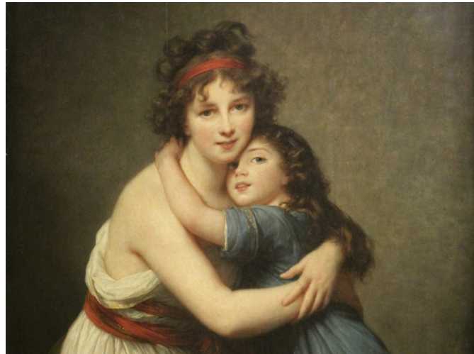
Görsel 2. Elisabeth Vigee Le Brun, Julie ile Otoportre (1787), Tuval üzerine Yağlıboya