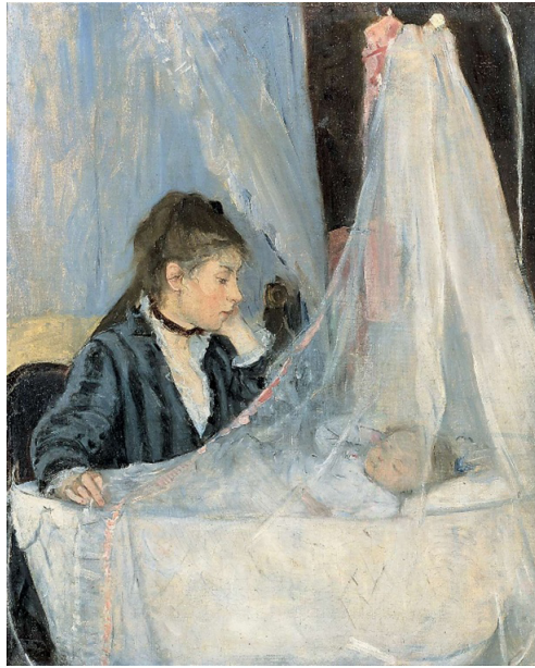
Görsel 4. Berthe Morisot, Beşik (1872), Tuval üzerine Yağlıboya, 56 cmx 46 cm

Buettner'in 19. yüzyıldaki değişen modern annelik temasıyla ilgili yazdığı makaleye (1986) göre Fransa'da yaşayan Berthe Morisot ve Mary Cassat, resimlerinde annelik temasını Rönesans döneminden bu yana ilk defa duygusal ve dini referansların dışında yansıtmışlardır. Bu ressamlar daha çok anne ve çocuk arasındaki psikolojik ilişkiyi irdelemişlerdir. Rönesans döneminde ise çok az da olsa kadın sanatçılar, annelik temasını erkek ressamlar gibi öncelikle dini, mitolojik ve tarihi referanslar içinde duygusal ve geleneksel kompozisyon şemasına göre resmediyorlardı.