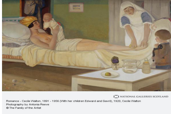
Görsel 7. Cecile Walton, Romans (1920), Tuval üzerine Yağlıboya, 100.60x150.90 cm

Sanatta annelik teması dendiğinde, Alman sanatçı Käthe Kollwitz önemli bir yere sahiptir. Sanatçı, oğlunu ve sonrasında torununu savaşta kaybetmiştir. Yaşadığı acıyı ve özlemi sanatına aktarmış, sanatını hem kendi hem de toplumun iyileşmesi için kullanmıştır. “Çalışmalarının ana izleğine dönüşen annelik temasında birçok baskı resim ve resim yapmıştır. Sanatçı, özellikle savaş sonrasında annelik teması üzerinde çok durmuş, savaşın anneler ve çocukları üzerindeki etkilerini ele alan sayısız baskı resim hazırlamıştır” (Daşçı, 2008, s.196).