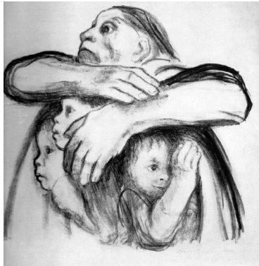
Görsel 8. Käthe Kollwitz, 1941 Mısır Tohumu Öğütülmemelidir , Litografi

Sanatta annelik teması dendiğinde, Alman sanatçı Käthe Kollwitz önemli bir yere sahiptir. Sanatçı, oğlunu ve sonrasında torununu savaşta kaybetmiştir. Yaşadığı acıyı ve özlemi sanatına aktarmış, sanatını hem kendi hem de toplumun iyileşmesi için kullanmıştır. “Çalışmalarının ana izleğine dönüşen annelik temasında birçok baskı resim ve resim yapmıştır. Sanatçı, özellikle savaş sonrasında annelik teması üzerinde çok durmuş, savaşın anneler ve çocukları üzerindeki etkilerini ele alan sayısız baskı resim hazırlamıştır” (Daşçı, 2008, s.196).