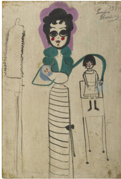
Görsel 15. Semiha Berksoy, Annem ve Ben (1974), Duralit Üzerine Yağlıboya, 100x70 cm