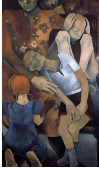
Görsel 17. Neş'e Erdok, Aile (1983), Tuval üzerine Yağlıboya, 230x135 cm

Neş'e Erdok'un bu resminin adı "Aile" olsa da burada öne çıkan annelik temasıdır. Anne ve çocukları arasındaki bütünlük burada da görülür. Annenin, oturduğu koltuğun çevresine yerleşen çocuklarıyla arasındaki fiziksel bağ güçlü bir şekilde ifade edilmiştir. Erdok, eserlerinin çoğunda kadınları sosyal hayatın içinde farklı kimliklerle tasvir eder. Annelik bu kimliklerden biri olarak çocuklarının sorumluluğunu alan, tedirgin ve yorgun kadının yüzünde okunur.