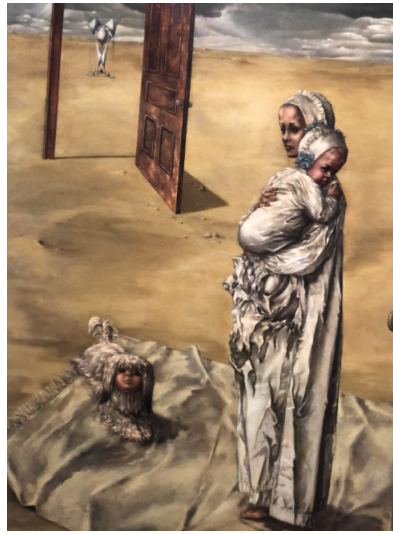
Görsel 13. Dorothea Tanning, Annelik (1946-1947), Tuval üzerine Yağlıboya, 42x121 cm