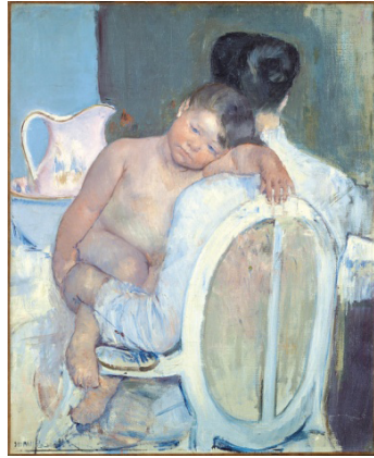
Görsel 5. Mary Cassatt, Kollarında Çocukla Oturan Kadın , 1890, Tuval üzerine Yağlıboya.

Cassatt (Görsel 5, 6) çocuksuz bir kadın olarak konuya daha çok gözlemci ve profesyonel bir tavırla yaklaşmış, annelik olgusunu modern hayatın, modern kadının sosyal hayattaki yerini yansıtmak adına kullanmıştır. Annelik, Cassatt için başkasına ait bir deneyim olsa bile, bu çekirdek malzemeyi alır ve kadınlığın ortak bir deneyim alanı olarak kullanır.