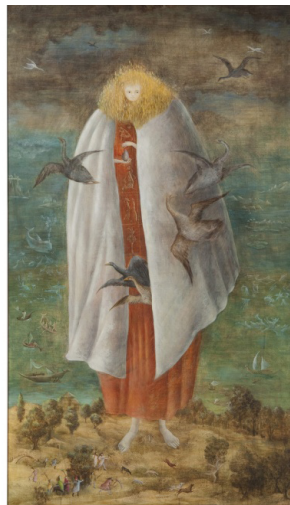
Görsel 12. Leonora Carrington, Yumurta Koruyucusu (1947), Tuval üzerine yağlıboya