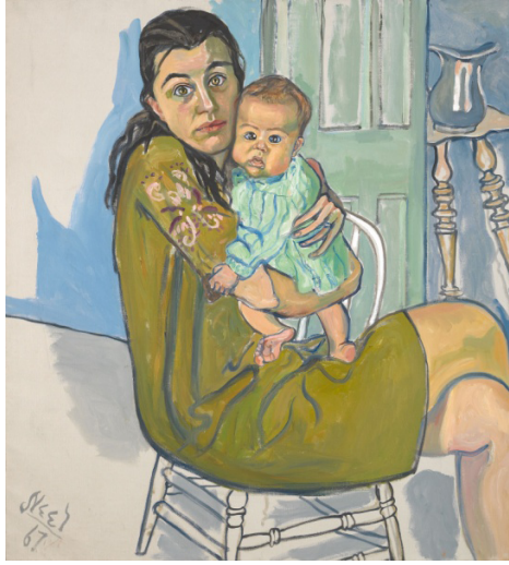
Görsel 14. Alice Neel, Anne ve Çocuk (1967), Tuval üzerine yağlıboya