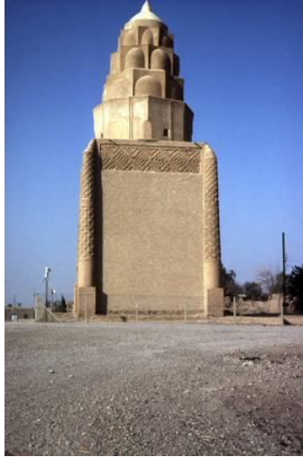
Görsel 4. İmam Dur Türbesi (Archnet) 8

Samerra civarında XI. yüzyılın sonunda inşa edilmiş ve İslâm dünyasında yapılmış ilk mukarnaslı kubbe addedilir. Bu kubbenin beş tabakalı mukarnasının birimleri, İran ve Orta Asya'daki büyük Selçuklu ve bir önceki dönemlerde yapılan mukarnasların birimlerine benzemektedir. Malzeme olarak da yine İran ve Maverâünnehir mukarnaslarında olduğu gibi alçı kullanılmıştır (Görsel 4-5).