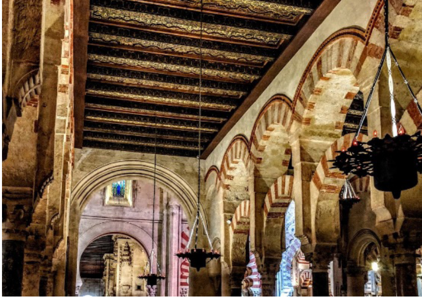
Görsel 10. Kurtuba Ulu Camii'nde Bir Sahnın Çatısı

Maldonado'ya göre de bu tarz örtülere XI. ve XII. asırdan itibaren Toledo, Malaga, Gırnata ve Almeria'da rastlanmaya başlar (Maldonado, c. 1, s. 154). Buna göre Almeria şehrinin XI. yüzyılında bu tarz örtü sistemlerini tanıdığı olmasında da zikredilen ihtimali güçlendirmektedir.