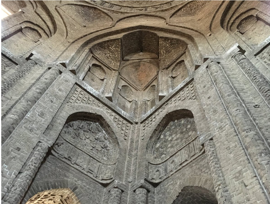
Görsel 3. İsfahan Camii'nin İbadet Mekanındaki Ana Kubbenin Mukarnaslı Tromplarından Bir Detay ( Mustafa Furkan Özren)

Büyük Selçuklu yapısı olan bu bina XI. asrın sonlarında inşa edilmiş olup farklı tarihlere ait çeşitli ilaveler görmüştür. Bu caminin farklı bölümlerinde ebadı farklı olan mukarnas örnekleri mevcuttur. Caminin ibadet mekanındaki ana kubbenin mukarnaslı tromplarının birimleri Arap Atâ Türbesi'ni hatırlatır (Görsel 3). Avlusunun XII. asırda eklenmiş (Çoruhlu, s. 504-506) eyvanlarındaki mukarnasların hücreleri daha eski tarihlere ait mukarnaslı trompların hücrelerinden daha gelişmiş bir vaziyettedir.