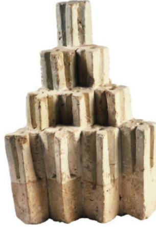
Görsel 8. Benî Hammâd Kalesinde Bulunan Bir Unsur (Houria Cherid) 11

Cezayir'de XI. yüzyılda Berberîler tarafından kurulan bir kale-şehirdir. Burada yer alan Kasrû'l Bahr denilen mevkide pişmiş topraktan mamul merdivenli şekilde birbirine yapıştırılmış piramidal bir hale gelmiş paralel yüzlerden teşekkül eder (Görsel 8).