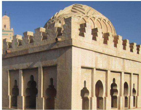
Görsel 7. Murabıtlar Kubbesi

Yanıdaki Ali bin Yusuf camisi için abdest alma yeri olduğu düşünülen bu kubbe, Ali bin Yusuf (1107- 1143) zamanında Marakeş şehrinde inşa edilmiştir. Nebatî süslemelerle oyulmuş sekizgen şeklinde olan bu kubbenin dört köşesinde birer mukarnaslı küçük kubbe yer almaktadır. Bu kubbelerin mukarnası iki tabakalı olup tepesi ortadaki büyük kubbede olduğu gibi sekiz dilimlidir (Görsel 7).