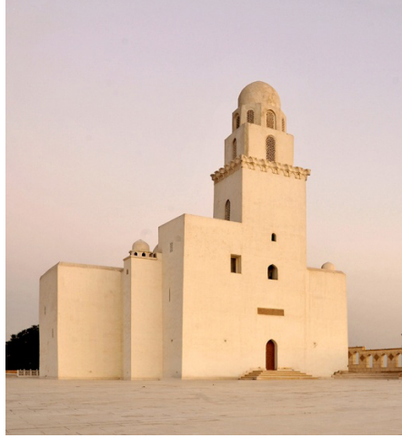
Görsel 6. El-Cüyüşî Camii'nin Minaresi (Faiz-E-Haakimi) 10

katlı bir minare yer alır. Ayrıca minarenin gövdesinin üst kenarında nadir rastlanan mukarnaslı bir korniş bulunmaktadır (Görsel 6). Bu mukarnas iki tabakalı olup hücreleri de Kümbeti Ali mukarnasının hücrelerine benzemektedir.