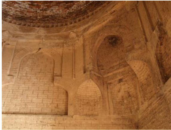
Görsel 1. Arap Atâ Türbesi (Okuryazarım) 6

Karahanlı dönemine ait en eski türbelerden biri olup bugünkü Özbekistan'ın Tim şehrinde 978 yılında inşa edilmiş bir türbedir. Bu türbenin kubbesi kare planlı bir kasnak üzerine oturtulmuş ve dört köşesinde ilkel mukarnas diyebileceğimiz birer tromp yerleştirilmiştir (Görsel 1). Bu tromplar, üst kısmı niş şeklinde bir birim, alt kısmı ise el-Kâşi mukarnası diye bilinen mukarnas hücresinin biçiminde olan üç birim olarak iki tabakadan ibarettir. Bu düzen, bildiğimiz mukarnas yapısına çok benzeyen bir düzendir. Bu örnek, beyitlerinin mevcut örnekler arasında en basit olanı olduğu için mukarnasın ilk örneklerine yakın olduğunu söylemek mümkündür.