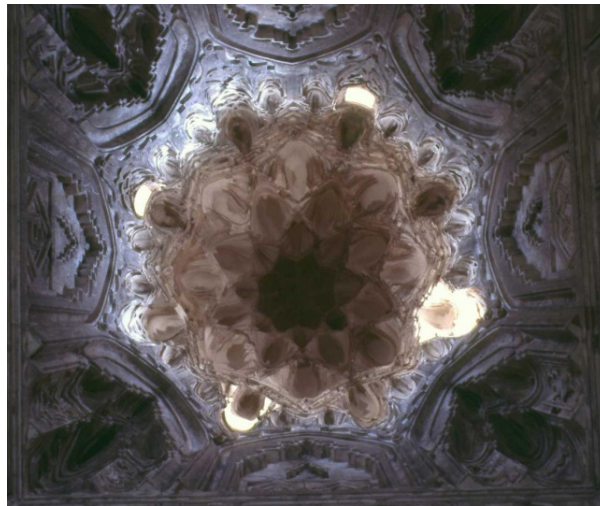
Görsel 5. İmam Dur Türbesi; Kubbenin İçi 9