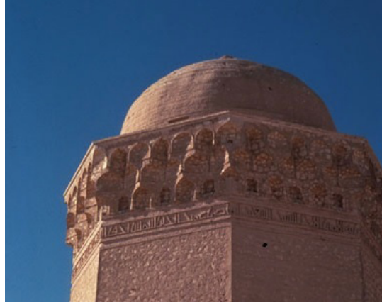
Görsel 2. Kūmbed-i Âlî (Okuryazarım) 7